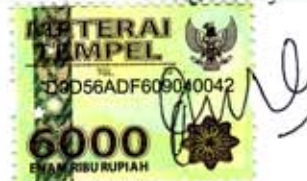
Habib Muh. Mansyur 09110072