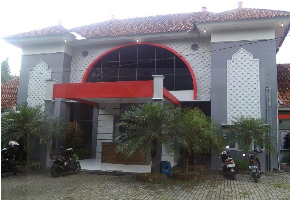
FOTO RUANG PERKULIAHAN