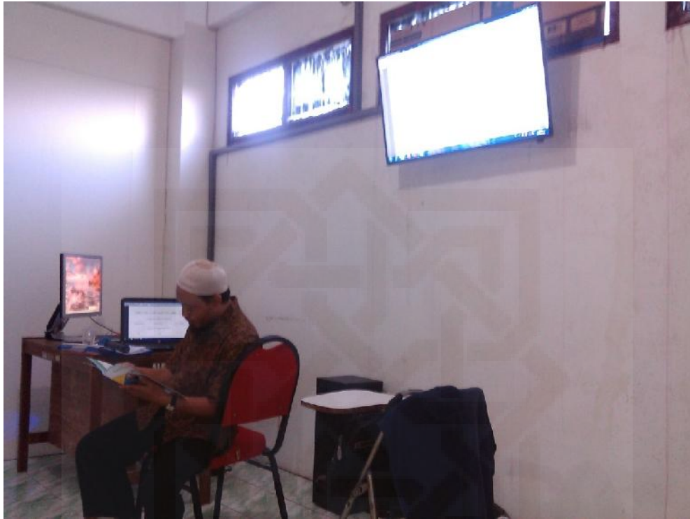
FOTO PRAKTIK PEMBELAJARAN BAHASA ARAB