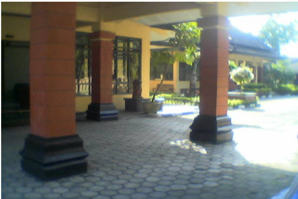
Gambar: Aula PSTW Yogyakarta Unit Budhi Luhur