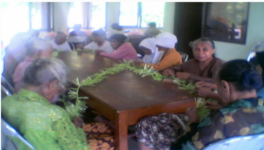
Gambar salah satu bentuk kegiatan pembinaan keterampilan. Tampak para seimbah puteri sedang mengerjakan tali rafia yang akan digunakan untuk membuat sulak/ kemoceng.