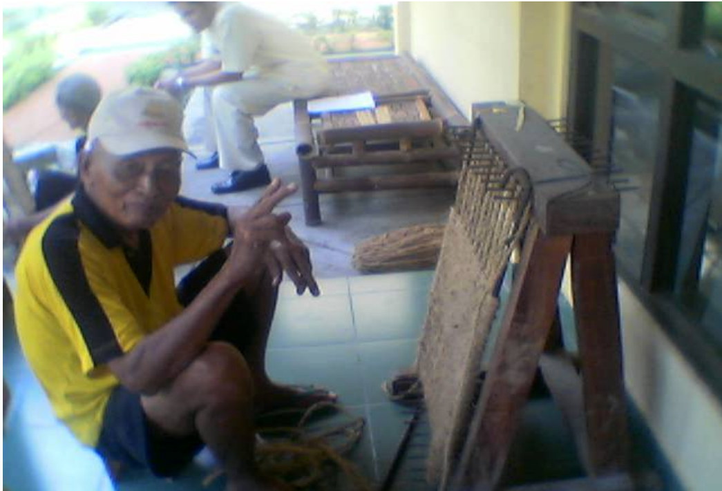
Gambar salah satu bentuk pembinaan keterampilan. Tampak simbah sedang membuat keset