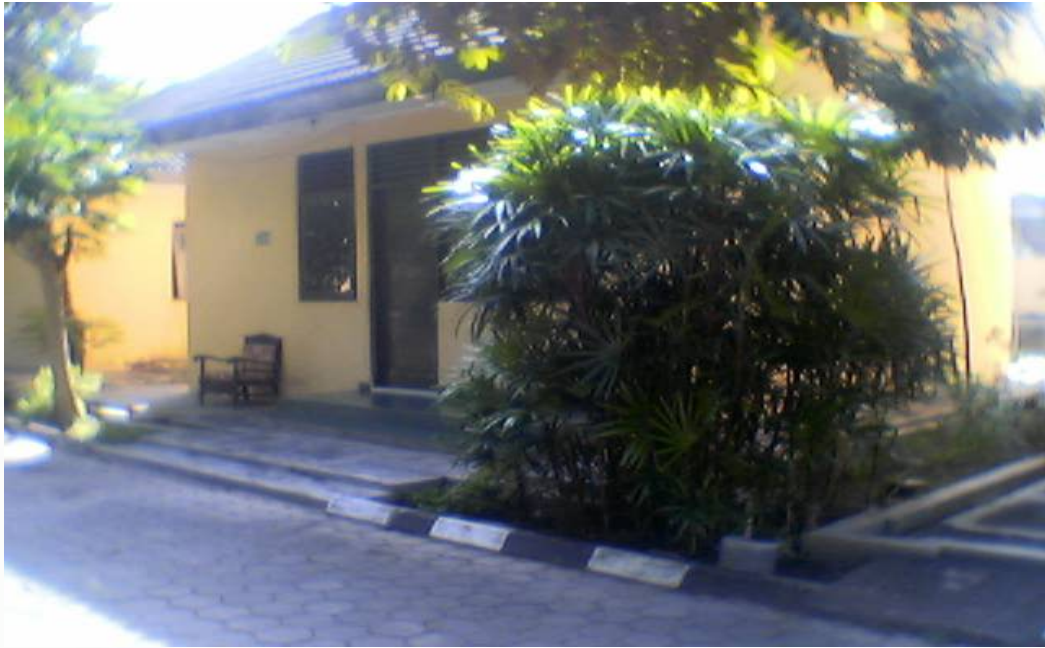
Gambar Salah Satu Wisma Yang Ada di PSTW Yogyakarta unit Budhi Luhur