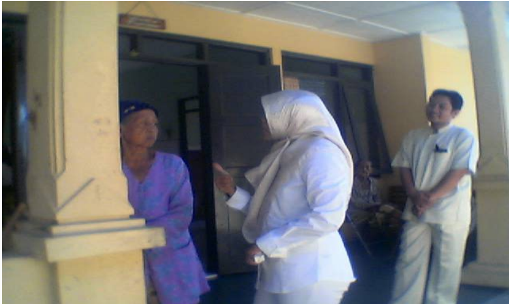
Gambar di atas merupakan salah satu kegiatan pembinaan kesehatan. Tampak seorang simbah mengkonsultasikan kesehatannya kepada tim medis.