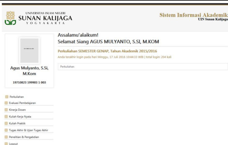
Gambar 3. Tampilan Menu Sistem Informasi Akademik.