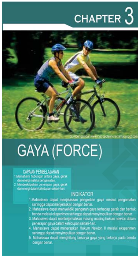
Gambar4. Cover Pembatas Bab

Adapun Cover BAB dapat dilihat pada gambar di bawah ini.