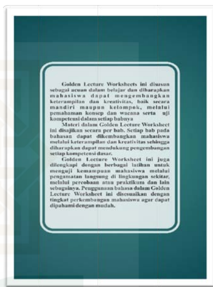
Gambar2. Cover luar bagian Belakang

Setelah dilakukan revisi Cover luar bagian depan dan belakang dapat dilihat pada gambar di bawah ini.