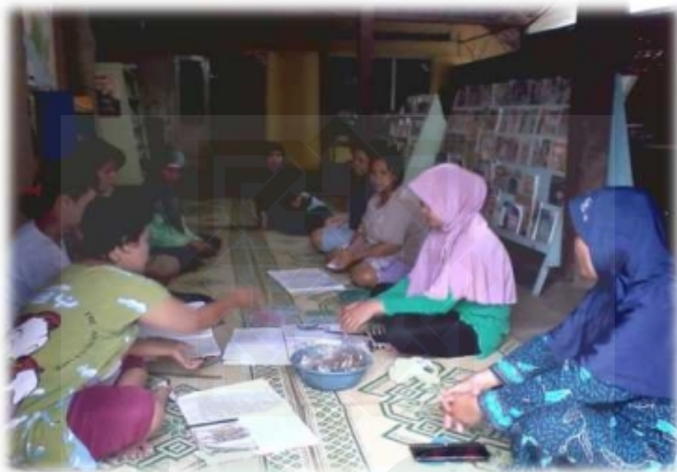
Kegiatan ibu-ibu setiap minggu sore