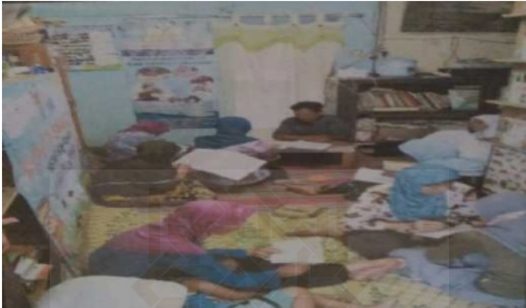
Kegiatan ibu-ibu mengaji di setiap hari kamis sore