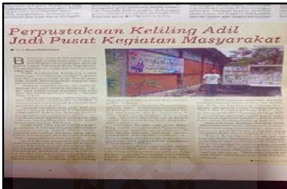
Liputan media massa