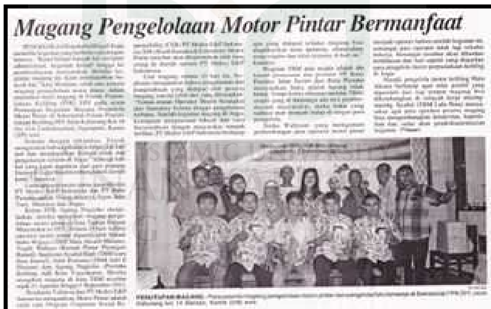
Liputan media masa