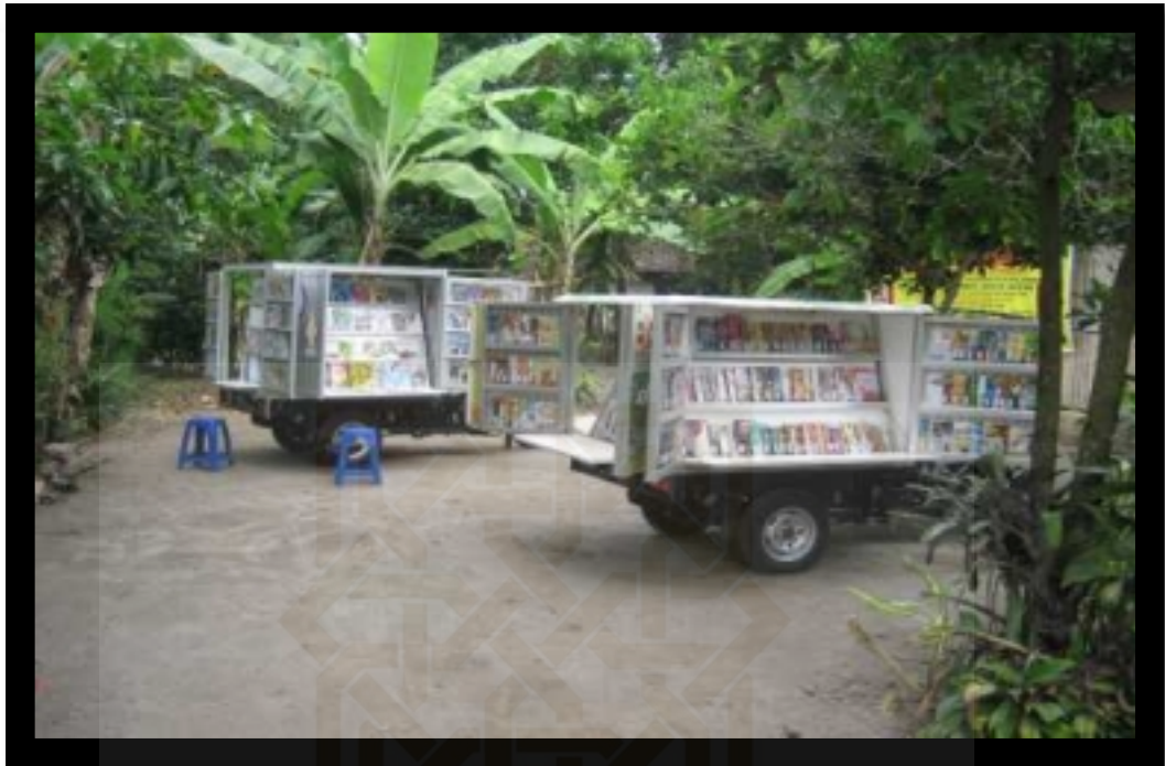
Motor pintar Taman Bacaan Masyarakat (TBM) Adil 2