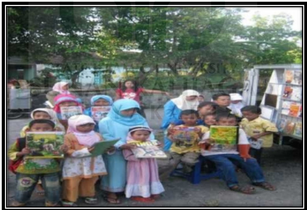
Kegiatan perpustakaan keliling Taman Bacaan Masyarakat (TBM) Adil 2