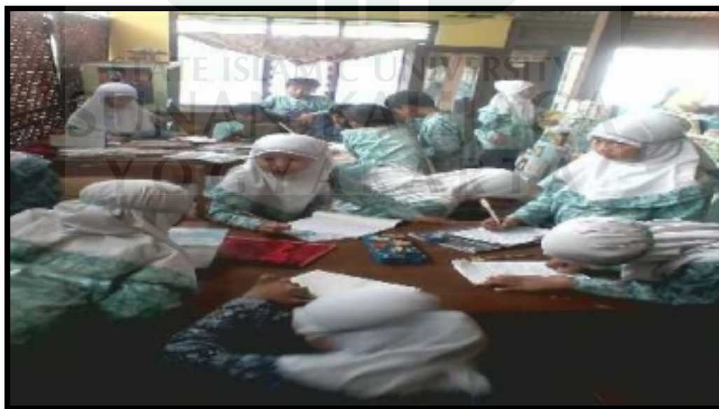
Anak-anak sedang memanfaatkan koleksi Taman Bacaan Masyarakat Adil 2