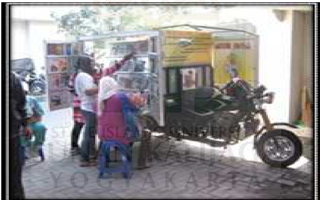
Masyarakat memanfaatkan koleksi perpustakaan keliling Taman Bacaan Masyarakat (TBM) Adil 2