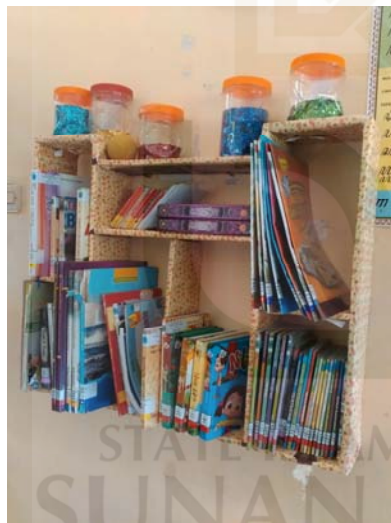
Gambar 3 Rak buku peminjaman kolektif.