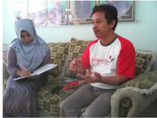
Gambar 20 Wawancara dengan informan delapan.