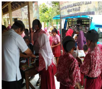
Gambar 9 Kegiatan peminjaman koleksi.