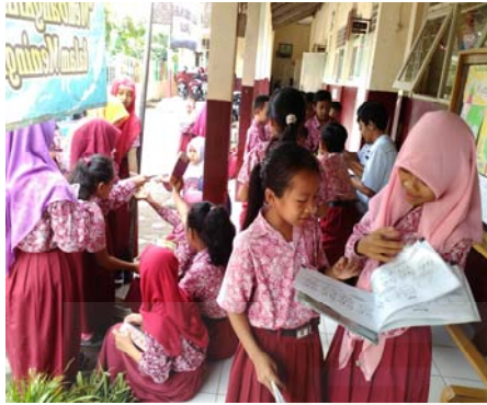
Gambar 11 Para siswa sibuk dengan aktivitasnya masing-masing.