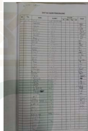
Gambar 26 Absensi pengunjung perpustakaan keliling.