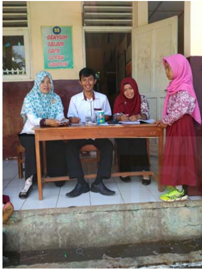
Gambar 19 Wawancara dengan informan tujuh.