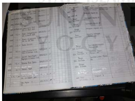
Gambar 27 Buku daftar anggota baru perpustakaan keliling.