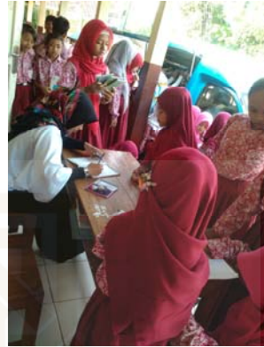
Gambar 2 Kegiatan peminjaman koleksi di Perpustakaan Keliling.