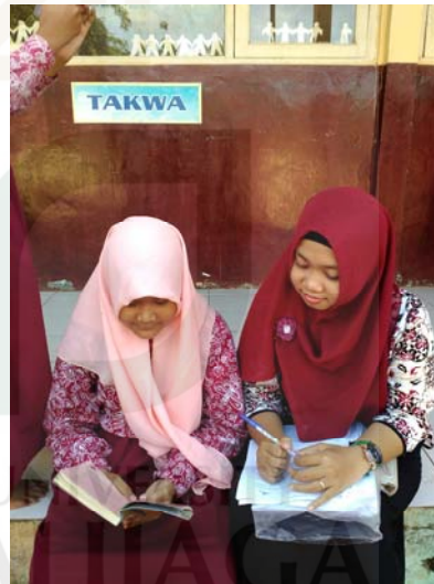
Gambar 18 Wawancara dengan informan empat.