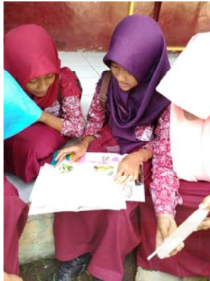
Gambar 5 Siswa sedang membaca buku bersama.