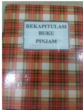
Gambar 23 Rekapitulasi buku pinjam.