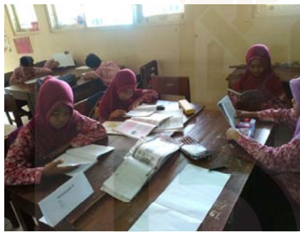
Gambar 7 Aktivitas membaca di jam istirahat.