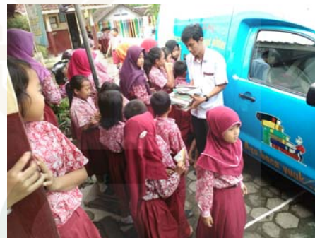
Gambar 8 Antusias para siswa ketika perpustakaan keliling datang.