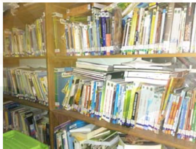
Gambar 30 Rak koleksi perpustakaan keliling