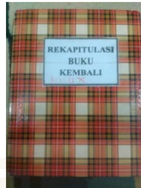
Gambar 24 Rekapitulasi buku kembali.