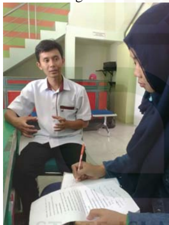
Gambar 21 Wawancara dengan informan sembilan.