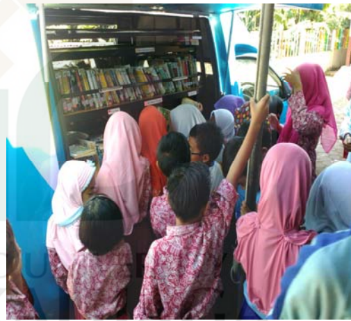
Gambar 4 Kegiatan memilih koleksi di Perpustakaan Keliling.