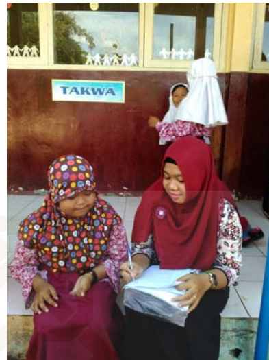
Gambar 16 Wawancara dengan informan tiga.