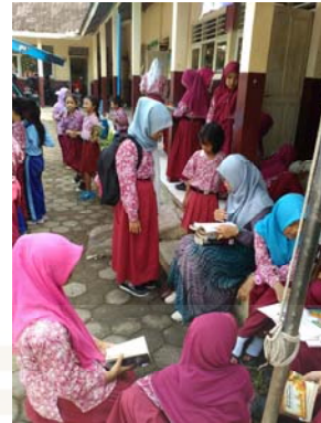
Gambar 6 Siswa meminta pendapat mengenai koleksi yang akan dipinjamnya.