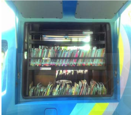
Gambar 1 Koleksi yang ada di Perpustakaan Keliling.