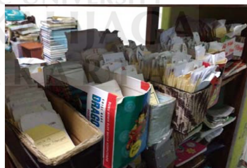
Gambar 28 Tempat kantong kartu anggota.