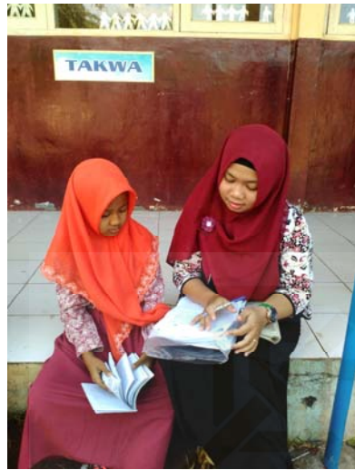
Gambar 15 Wawancara dengan informan dua.