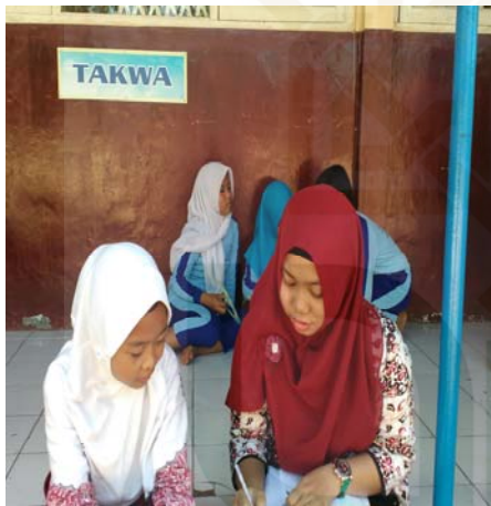
Gambar 13 Wawancara dengan informan lima.