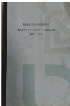
Gambar 25 Buku pengunjung layanan perpustakaan keliling.