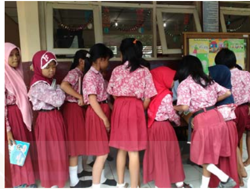
Gambar 12 Para siswa sedang antri untuk melakukan peminjaman.