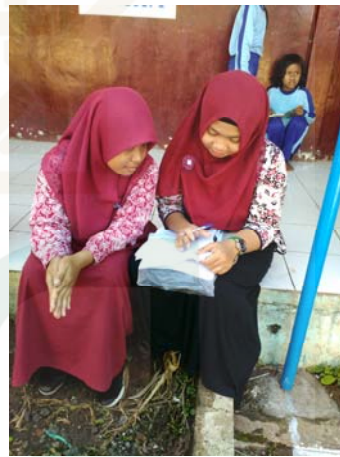
Gambar 14 Wawancara dengan informan satu