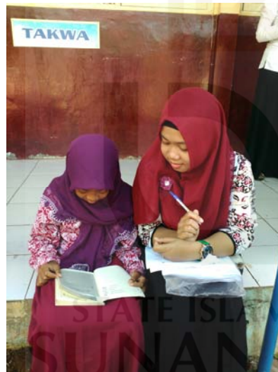
Gambar 17 Wawancara dengan informan enam.