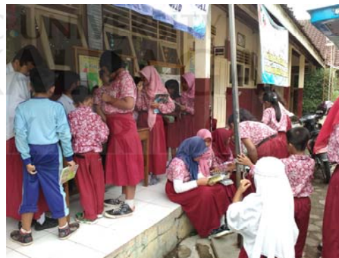
Gambar 10 Antrian panjang peminjaman koleksi.