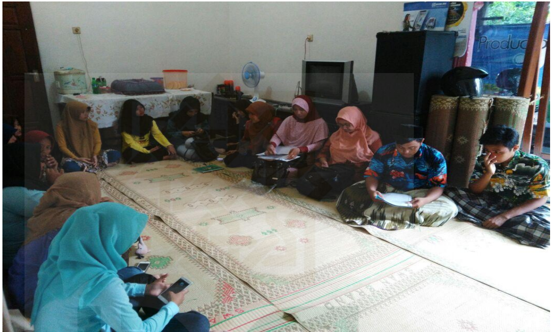
Foto Kegiatan Tausiyah