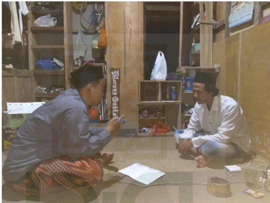
FOTO PELAKSANAAN PENELITIAN PONDOK PESANTREN AS SALAFIYYAH MLANGI