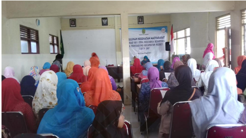
Pertemuan rutin PKK Desa Wonokromo