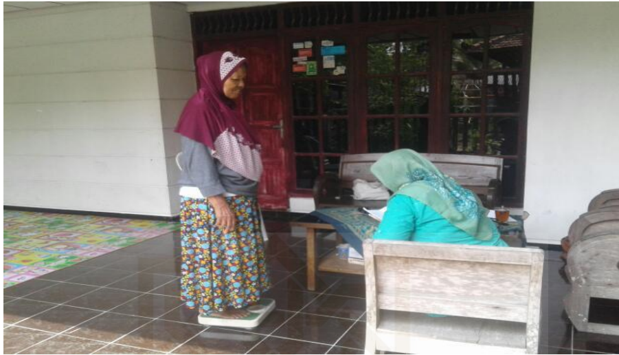
Kegiatan Posyandu Lansia oleh kader PKK