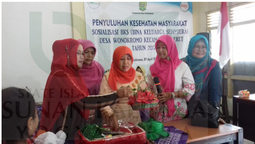
Kegiatan pelatihan merangkai hantaran oleh PKK Desa Wonokromo