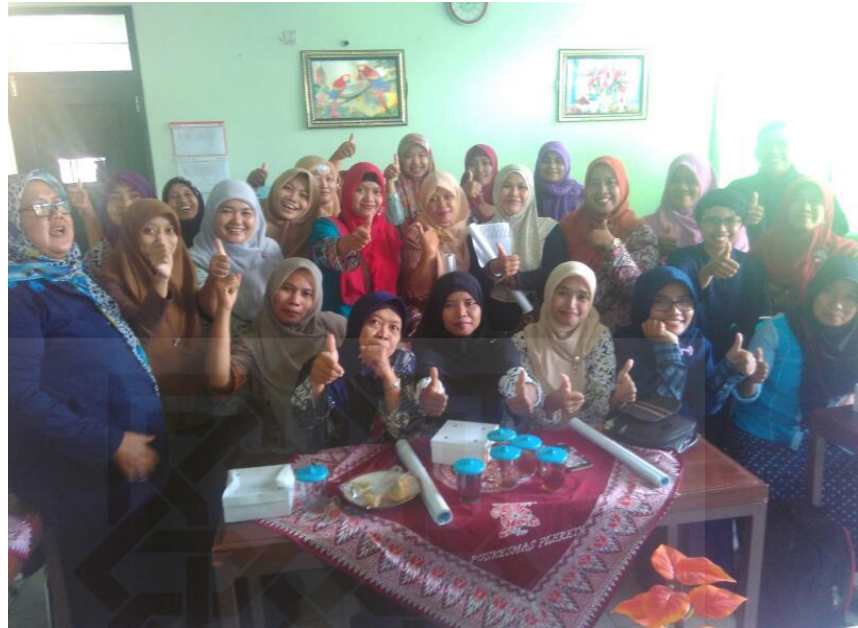
Pembentukan Kader Posbindu, PKK Desa Wonokromo & Puskesmas Kec. Pleret