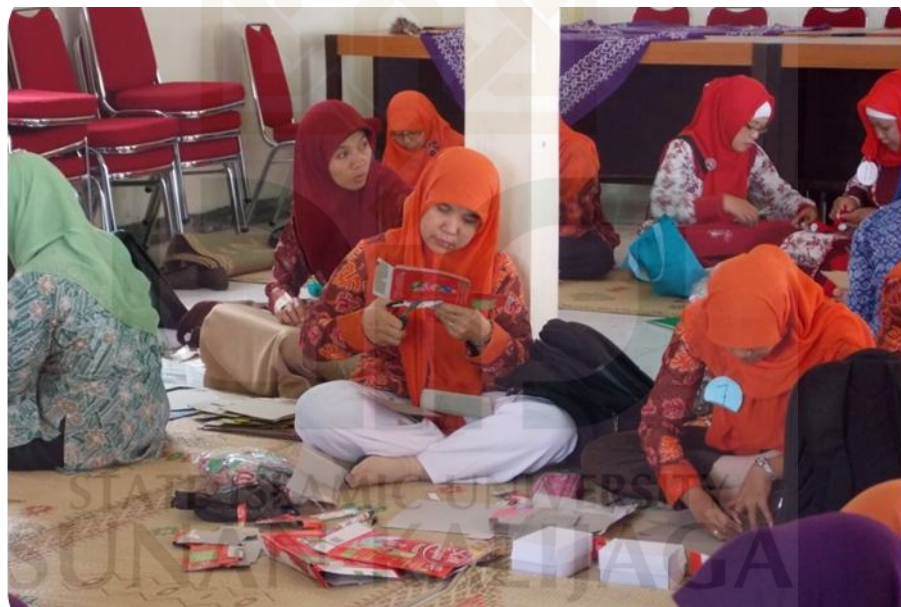
Pelatihan pembuatan APE oleh Pokja 2 PKK Desa Wonokromo