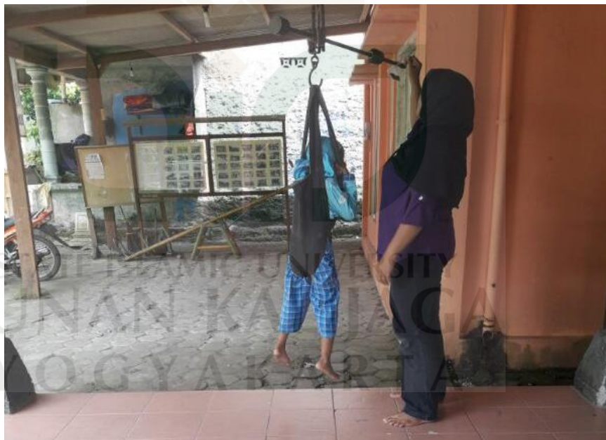
Penimbangan balita oleh kader Posyandu