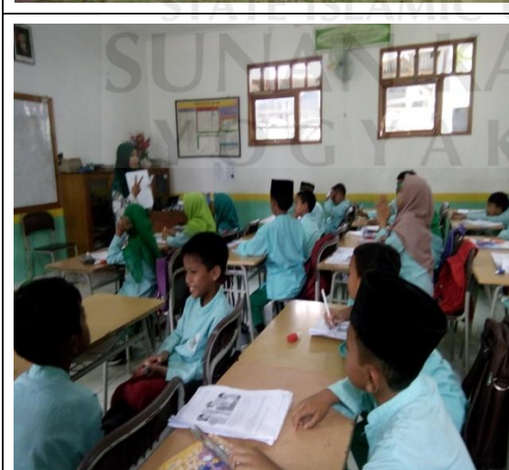
Guru menjelaskan materi yang ada di buku peserta didik