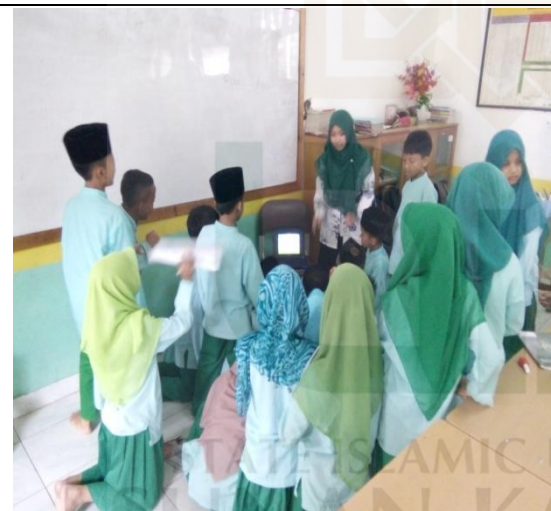
Peserta didik melakukan pengamatan yang ada di power point