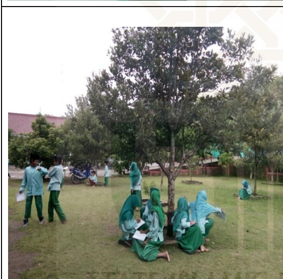
Peserta didik melakukan pengamatan di luar kelas