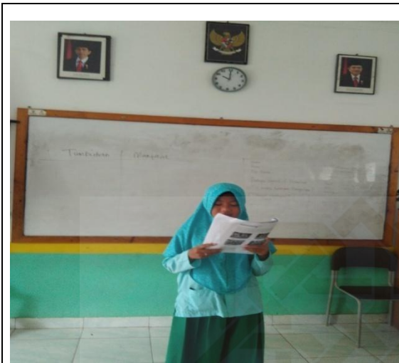
Peserta didik mempresentasikan hasil pengamatan