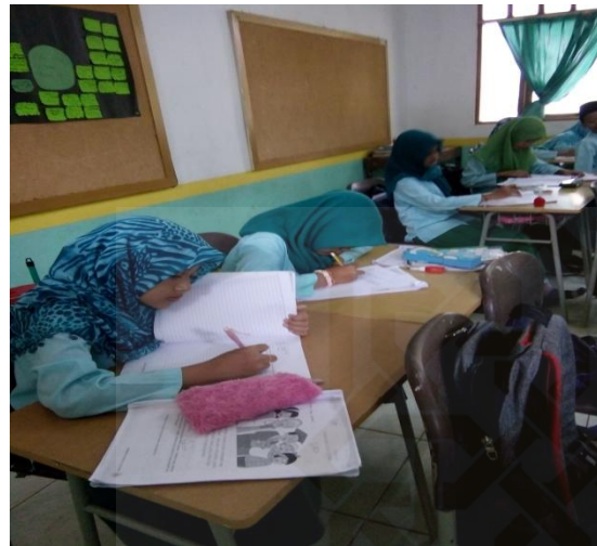
Peserta didik mengerjakan soal