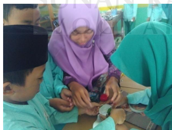
Guru membimbing peserta didik