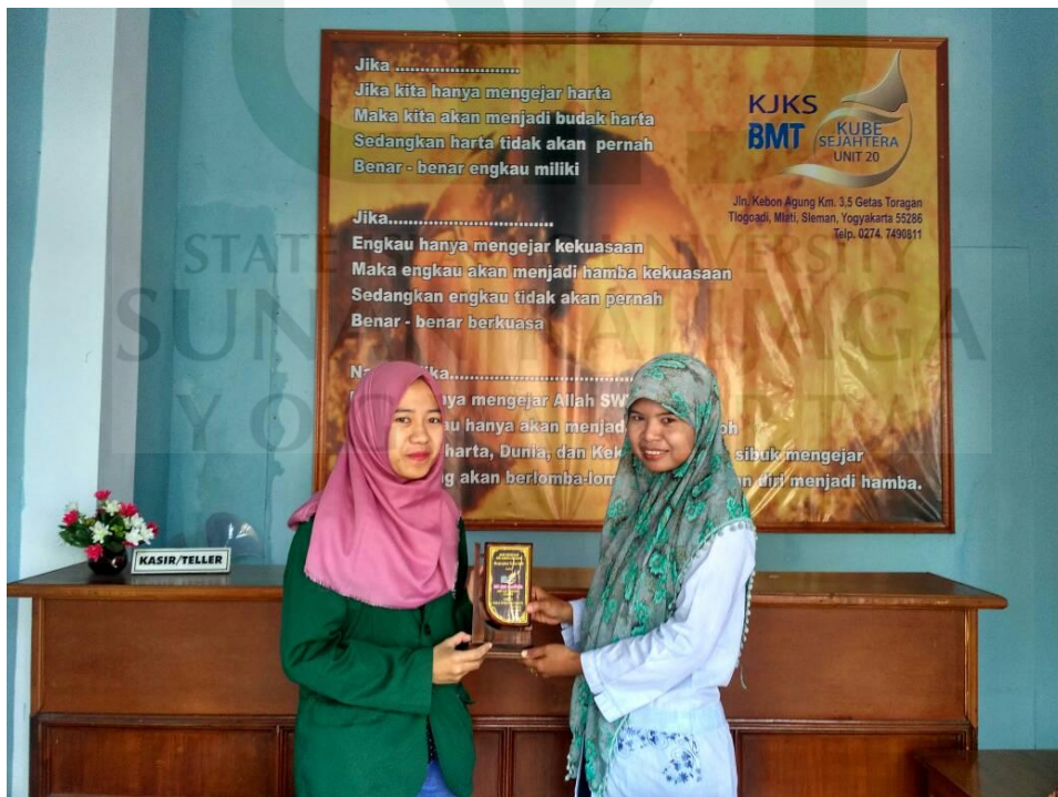
Penyerahan Plakat kepada Pihak BMT