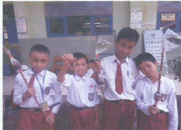
Kegiatan Belajar Mengajar (Praktek Mencangkok)