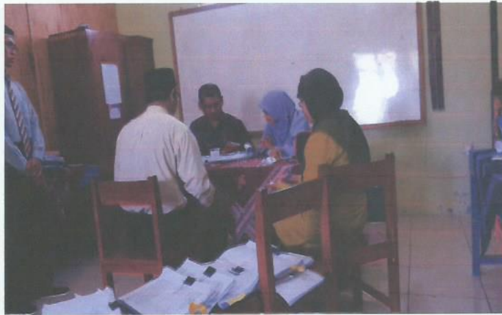
Akreditasi Sekolah SD Muhammadiyah Karangturi