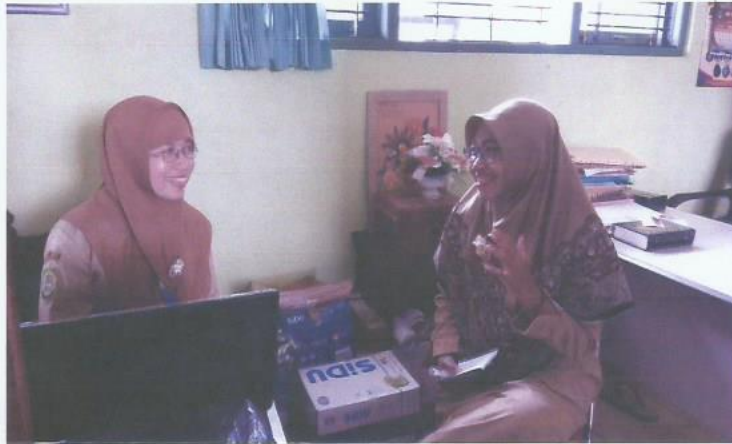
Wawancara Kepala Sekolah (PLh) SD Muhammadiyah Karangturi