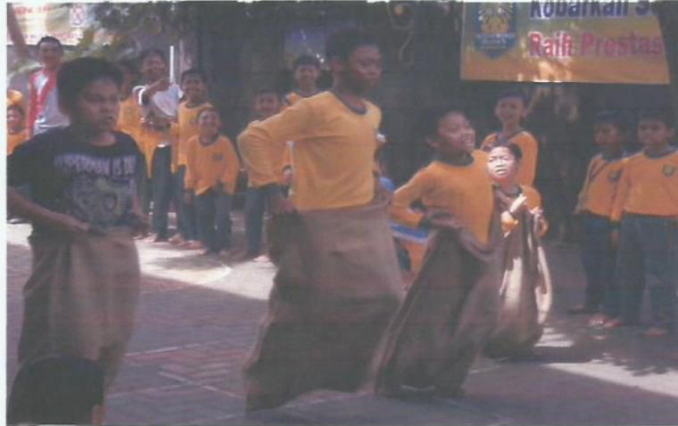
Lomb Balap Karung Sempena HUT RI 71 Tahun