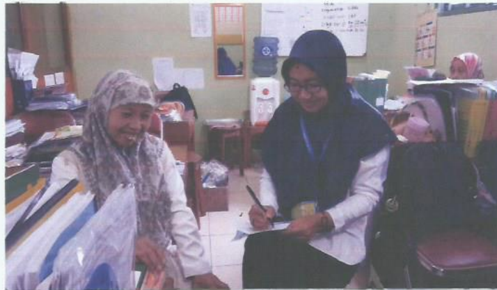
Wawancara Bendahara SD Muhammadiyah Karangturi