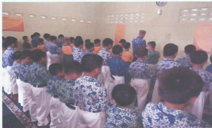
Pembiasaan Sholat Sunat Dhuha Berjama'ah