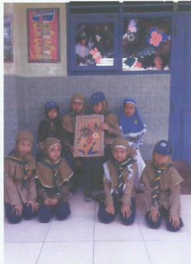
Ekstrakurikuler HW SDM Karangturi