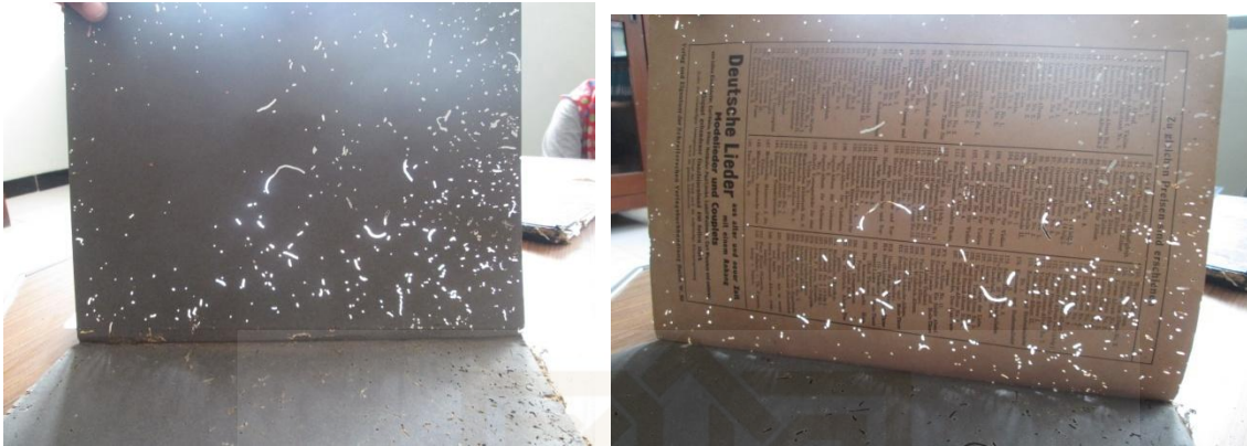
Sumber: Fotobuku rusak ka factor serangga, koleksi di perpustakaan SMK N 2 Kasikan, shelving bukuk pada tanggal 10 maret 2014