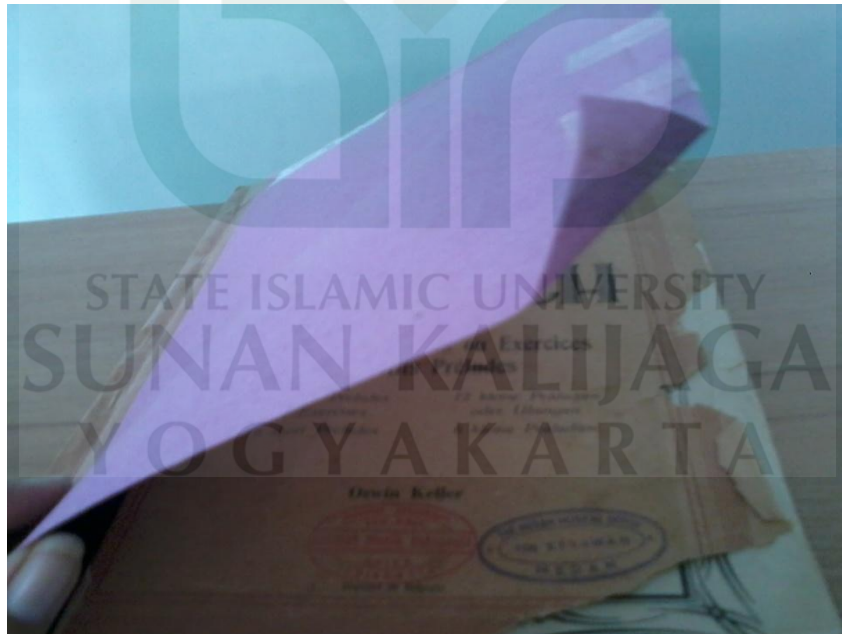
Sumber: Foto kegiatan PKL di perpustakaan SMK N 2 Kasikan, buku yang rusak pada tanggal 10 maret 2014