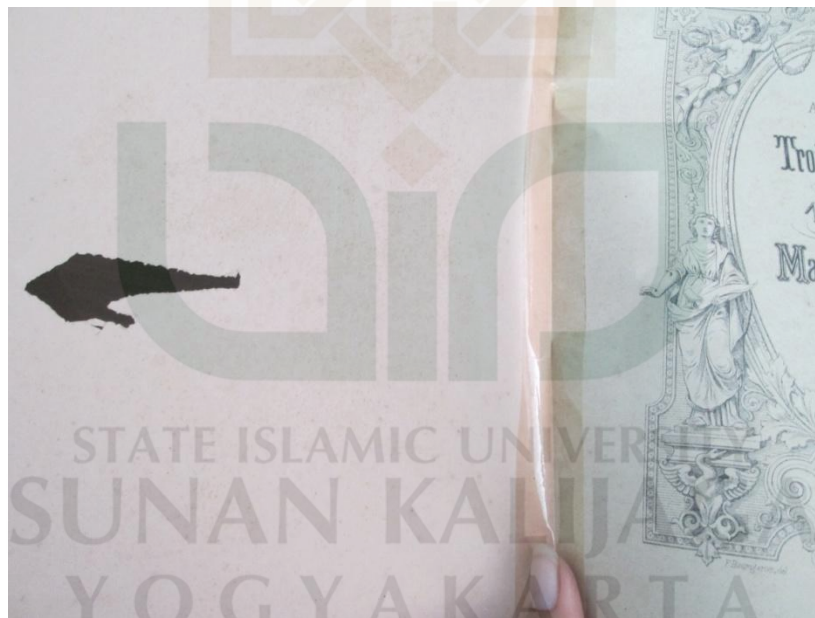
Sumber: Fotobuku rusak ka factor manusia, koleksi di perpustakaan SMK N 2 Kasikan, shelving bukuk pada tanggal 10 maret 2014