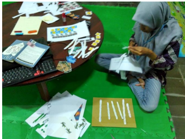
Persiapan trivia games