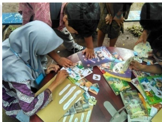
Kegiatan trivia games