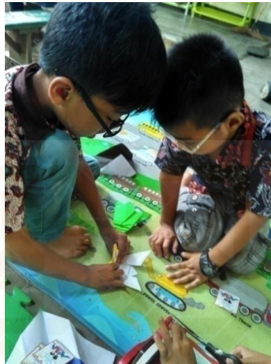
Kegiatan workshop origami