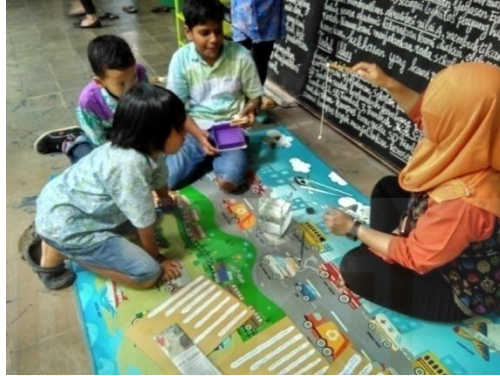
Kegiatan eksperimen menggunakan magnet