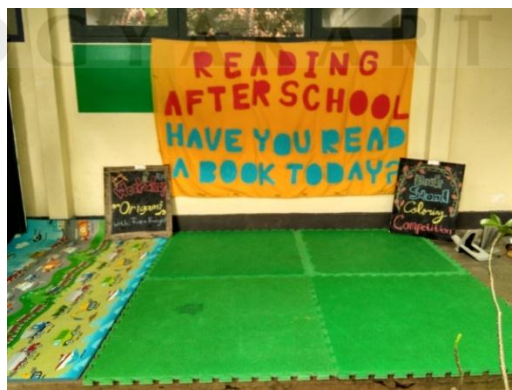
Dekorasi Reading After School