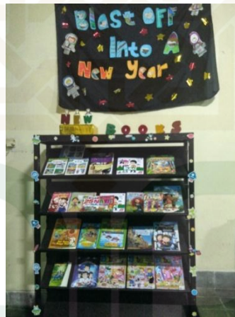
Rak buku untuk menaruh buku baru setelah dipamerkan pada kegiatan Reading After School