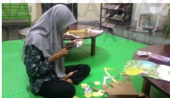
Persiapan Reading After School