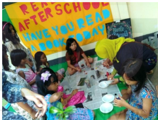
Kegiatan coloring book stand