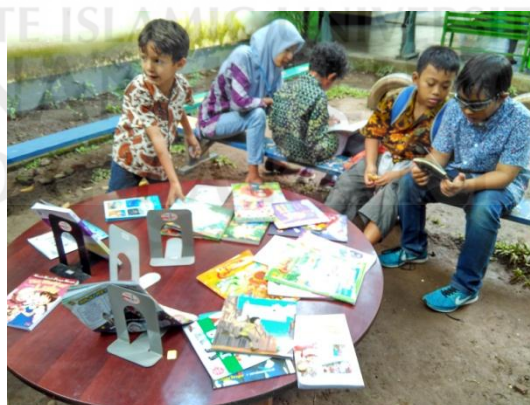
Suasana saat Reading After School bulan Februari