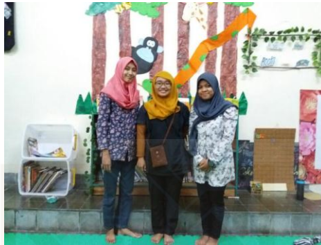
Foto bersama pustakawan SD Tumbuh 3 Yogyakarta