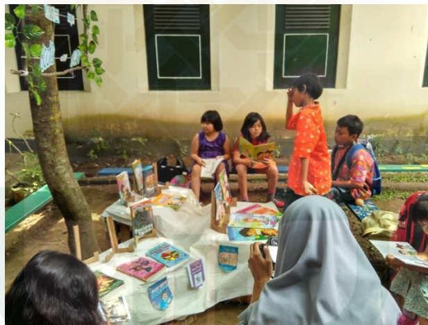
Suasana saat kegiatan Reading After School bulan Maret