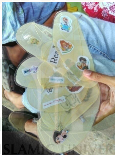
Bookmark untuk reward