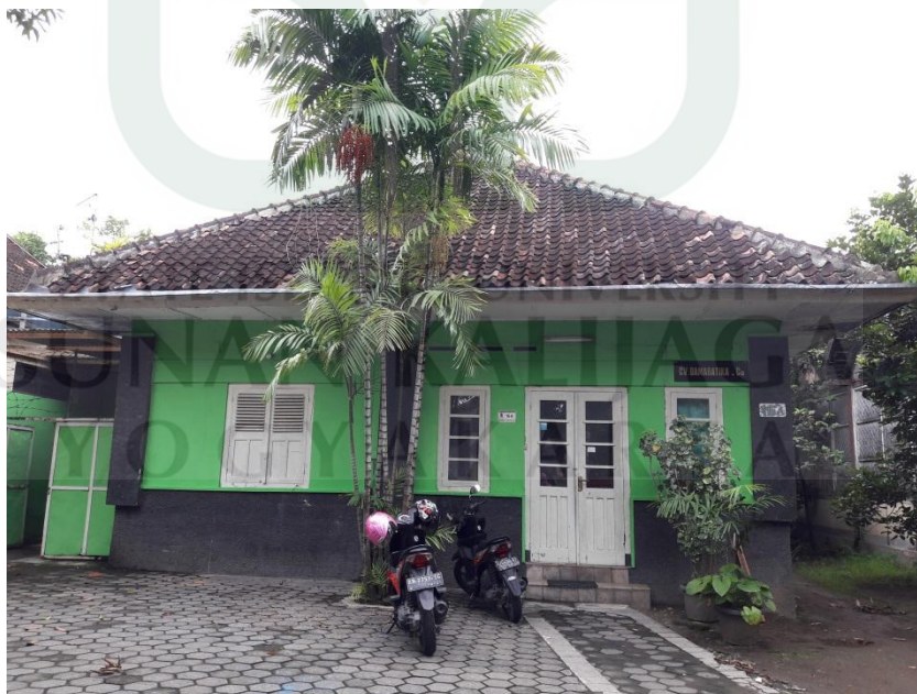
Lokasi penelitian peneliti yaitu Deaf Art Community (DAC)