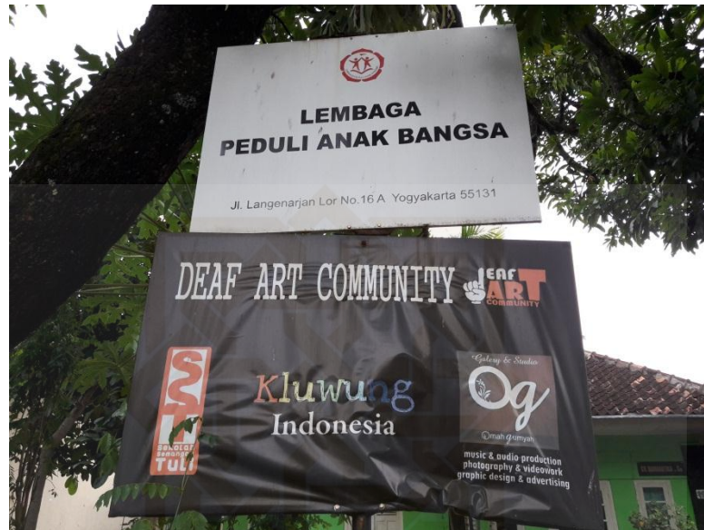
Lokasi Penelitian Peneliti.