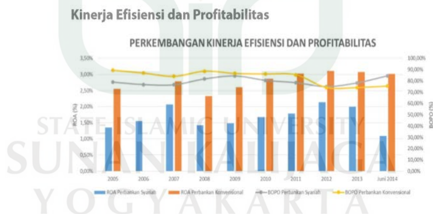
Gambar 1.2 Kinerja Efisiensi dan Profitabilitas

pihak yang memerlukan dana. Bank syariah yang didirikan dengan tujuan untuk kemaslahatan umat seharusnya menjalankan operasionalnya berdasarkan prinsip profit and loss sharing , tetapi kenyataannya di Indonesia bank syariah masih berprinsip revenue sharing sehingga tujuan didirikannya bank yang mana untuk kemaslahatan umat masih belum bisa dijalankan dengan baik oleh bank syariah. Meskipun sebagai lembaga yang profit oriented seperti lembaga keuangan lainnya, kesehatan kinerja keuangan yang diukur melalui Capital, Asset Quality, Management, Earning, dan Liquidity bank syariah menjadi sangat penting, terutama profitabilitas dan likuiditasnya . Karena itu dalam menilai kinerja bank syariah tidak hanya menitikberatkan kepada kemampuan bank syariah dalam menghasilkan laba tetapi juga pada kepatuhan terhadap prinsip-prinsip syariah.