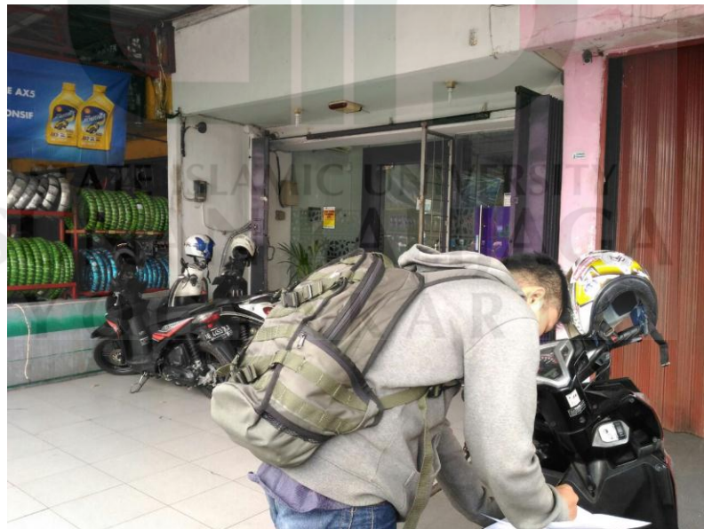
Penyebaran kuesioner di Bank Muamalat KC Ambarukmo