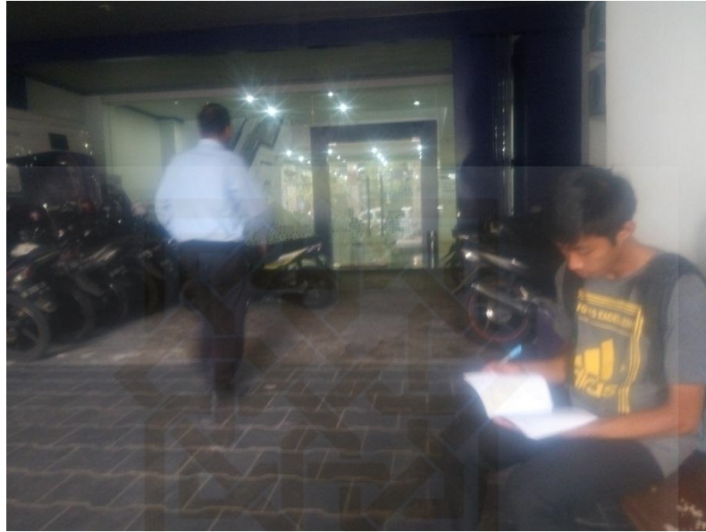
Penyebaran kuesioner di Bank Muamalat KCP Mangkubumi