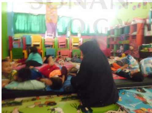
Guru bercerita sebelum anak tidur