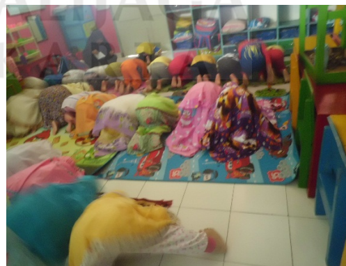
Kegiatan sholat dhuhur berjamaah