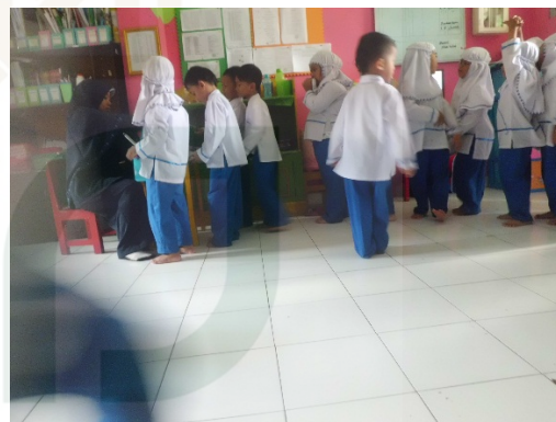
Budaya antri mengambil makan siang