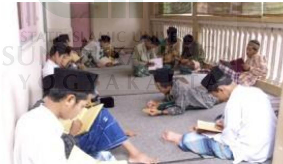
Gambar 3. Santri As-Salafiyyah Mlangi melaksanakan halaqah