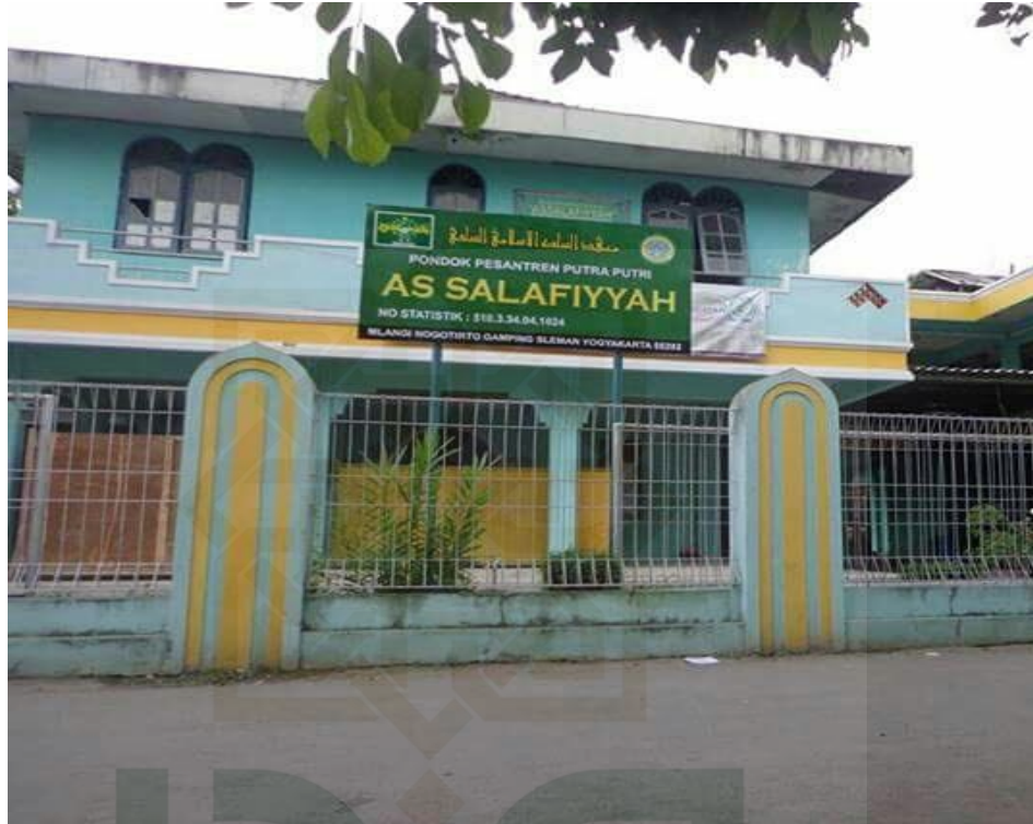
Gambar 3. Pondok Pesantren As-Salafiyyah Mlangi