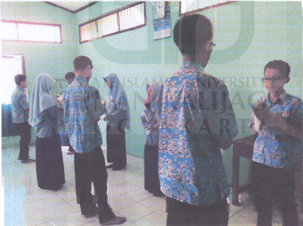
Gambar: Hafalan Mufrodat Kelas XI Prestasi MAN Klaten