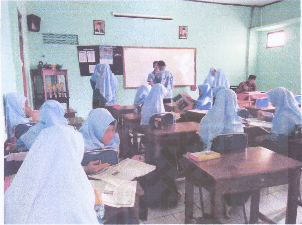
Gambar: Menunggu giliran hafalan mufrodat Kelas XI Prestasi MAN Klaten