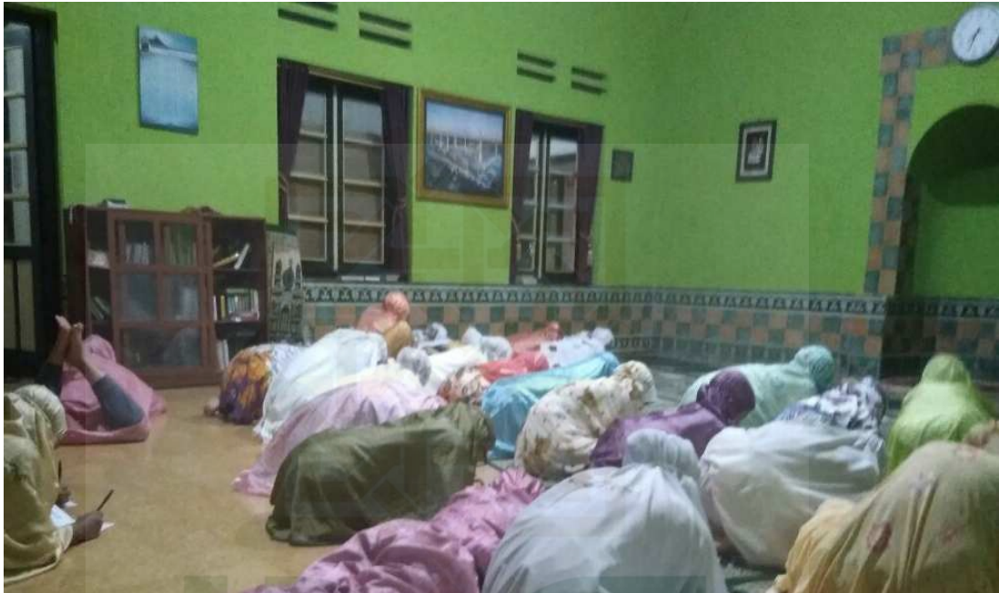
Foto 2. Pelaksanaan Try Out Skala Penelitian di Panti Asuhan Yatim Putri Islam RM Suryowinoto