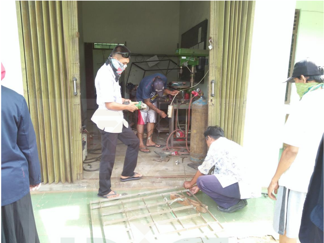
Warga binaan sedang membuat pagar besi untuk pesanan yang akan

STATE ISLAMIC UNIVERSITY SUNAN KALIJAGA YOGYAKARTA