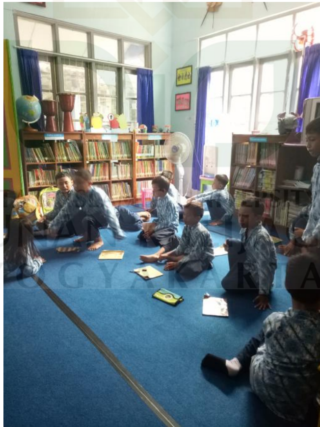
Lampiran 6 : Siswa-siswi pada saat berkunjung ke perpustakaan