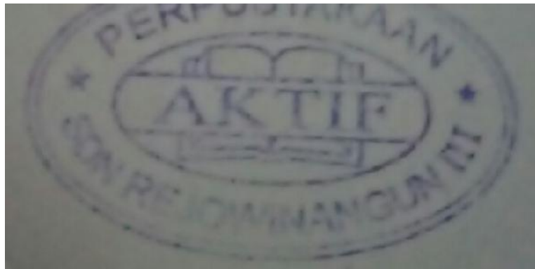
Lampiran 9 : Buku yang sudah di cap stempel