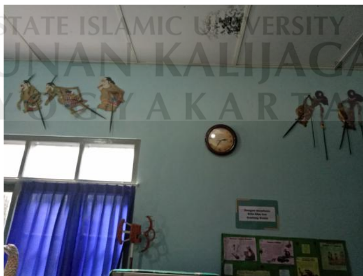
Lampiran 8 : Cat Di Perpustakaan SDN Rejowinangun 03 Yogyakarta