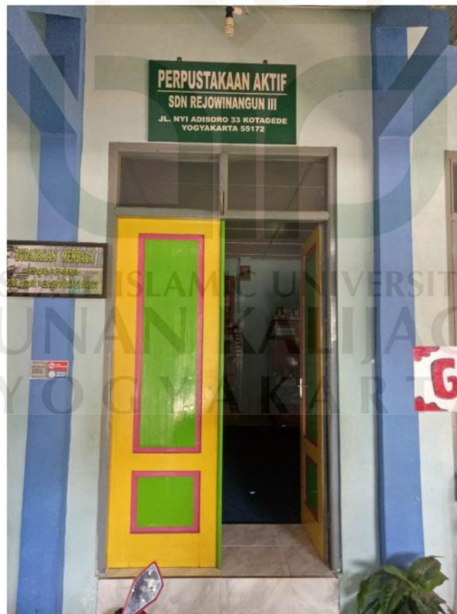
Lampiran 2 : Pintu masuk perpustakaan SDN Rejowinangun 3