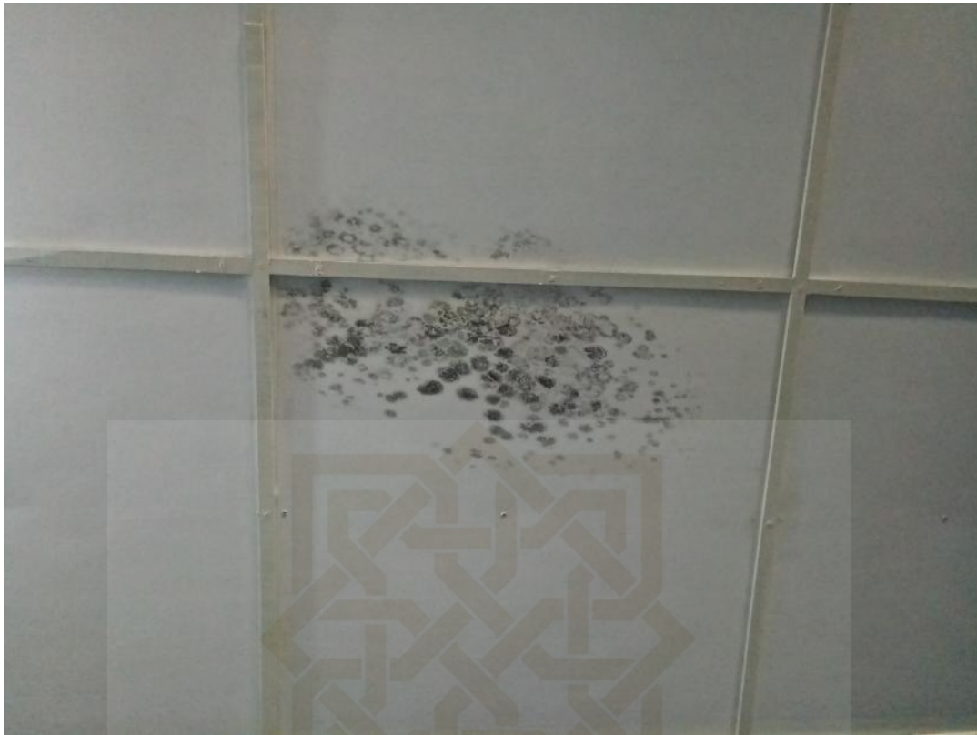
Lampiran 5 : Atap ruang perpustakaan yang berjamur