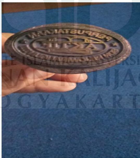
Lampiran 4 : Cap Stempel