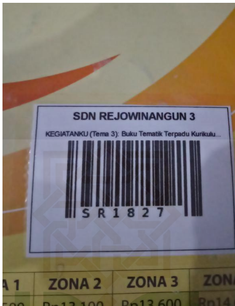
Lampiran 3 : Barcode pada buku yang telah di input