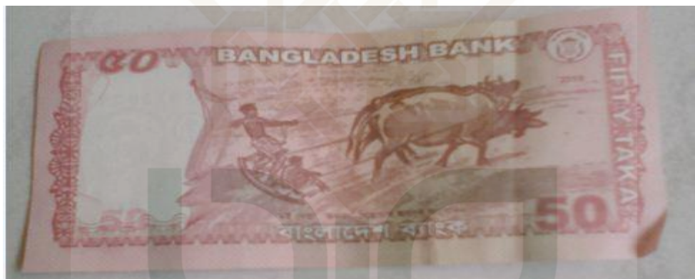
Taka , mata uang Bangladesh sekarang.