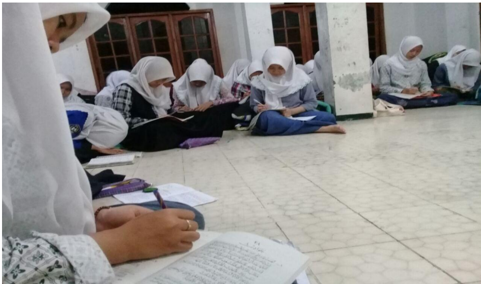
Siswa sedang menulis ma'na pegon yang dibacakan oleh presentator