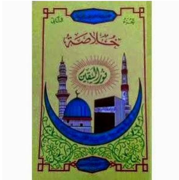
Kitab Khulashah Nur Al-Yaqin Jilid II (Materi Ajar kelas II M II A)