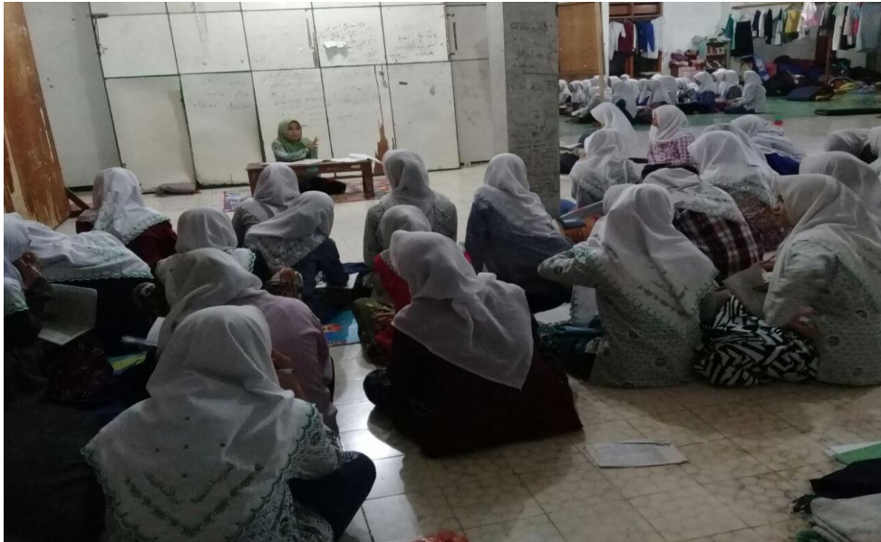
Guru menjelaskan materi tarikh