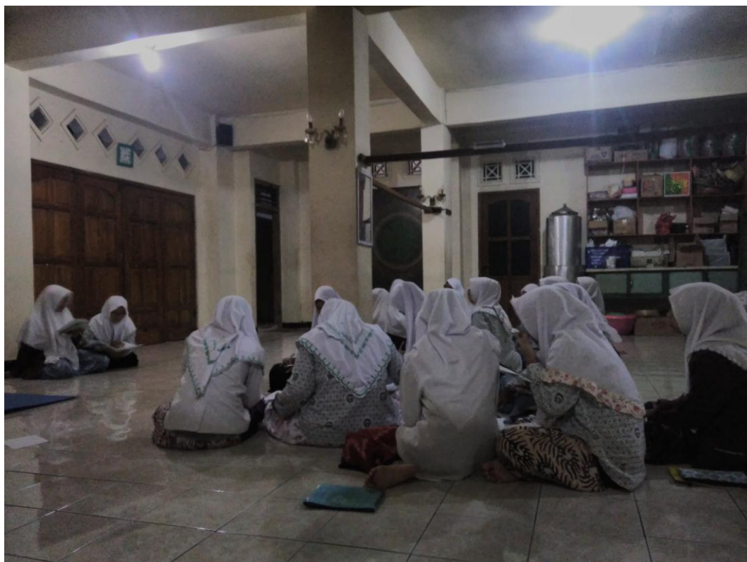
Dua siswa presentasi di depan kelas membacakan ma'nanan dalam kitab