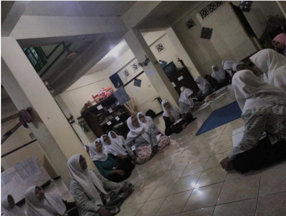
Siswa mendengarkan penjelasan presentator