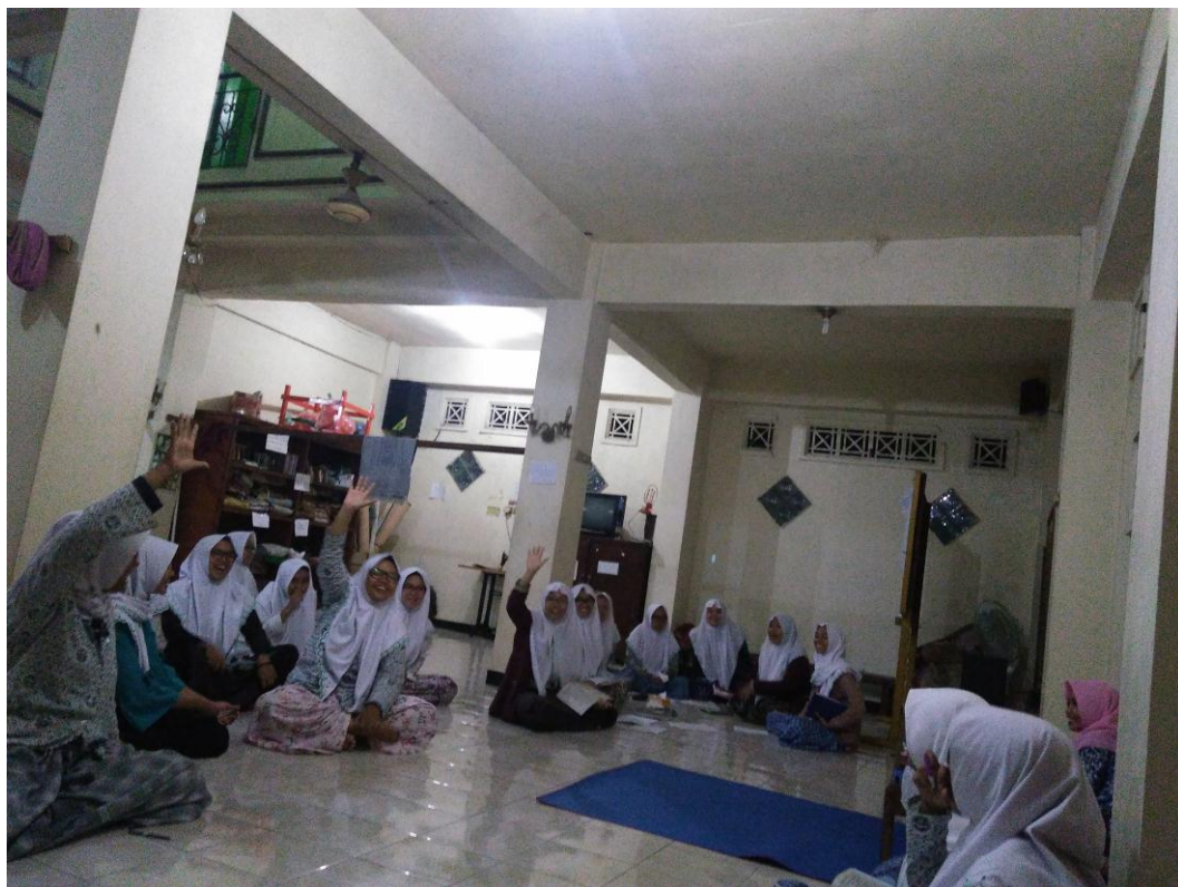
Siswa menjawab pertanyaan dari presentator