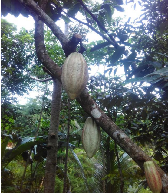
Pohon Kakao dan buahnya (Cokelat) di Desa Nglanggeran