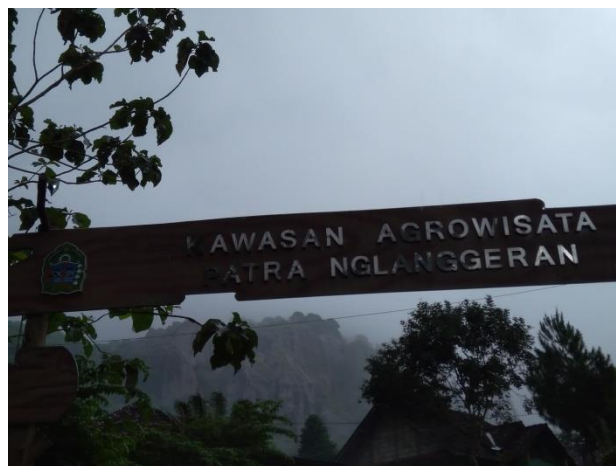
Gerbang Masuk Kawasan Agrowisata Patra Nglanggeran