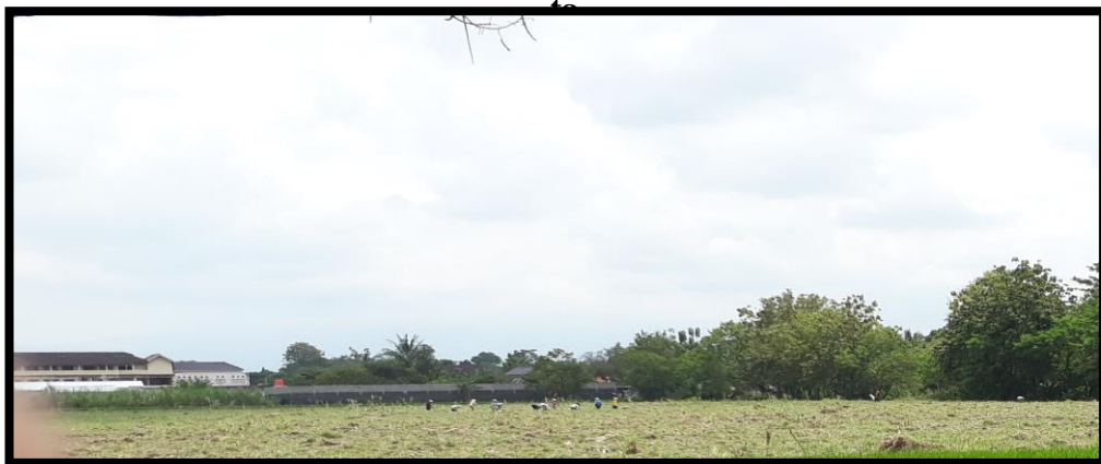
Lahan pertanian yang disewa Pabrik M sedang ditanamibenih oleh para petani Bantul