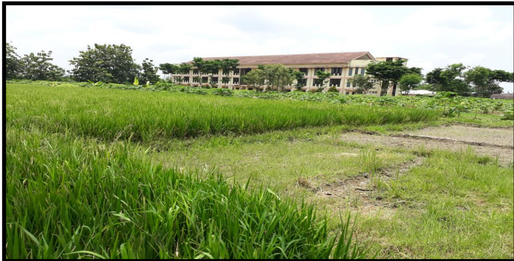
Tampak asrama mahasiswa dan lahan pertanian yang belum menjadi milik Yayasan