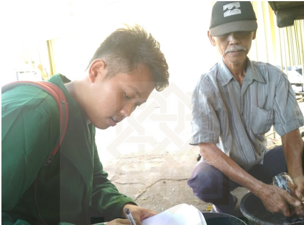
Foto pengisian kuisioner