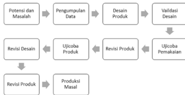
Bagan 1. Langkah Penelitian Pengembangan

Penelitian ini bertujuan untuk mengembangkan suatu produk berupa media pembelajaran berbentuk buku pop up sebagai media pembelajaran mata pelajaran Bahasa Indonesia kelas II semester 2.