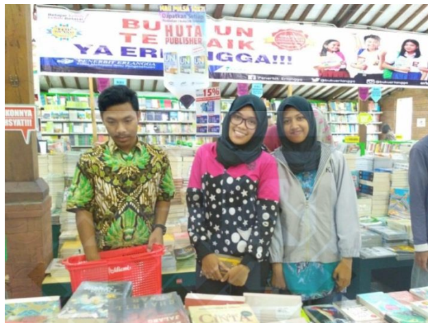
Pembelian buku di toko buku Toga Mas Yogyakarta