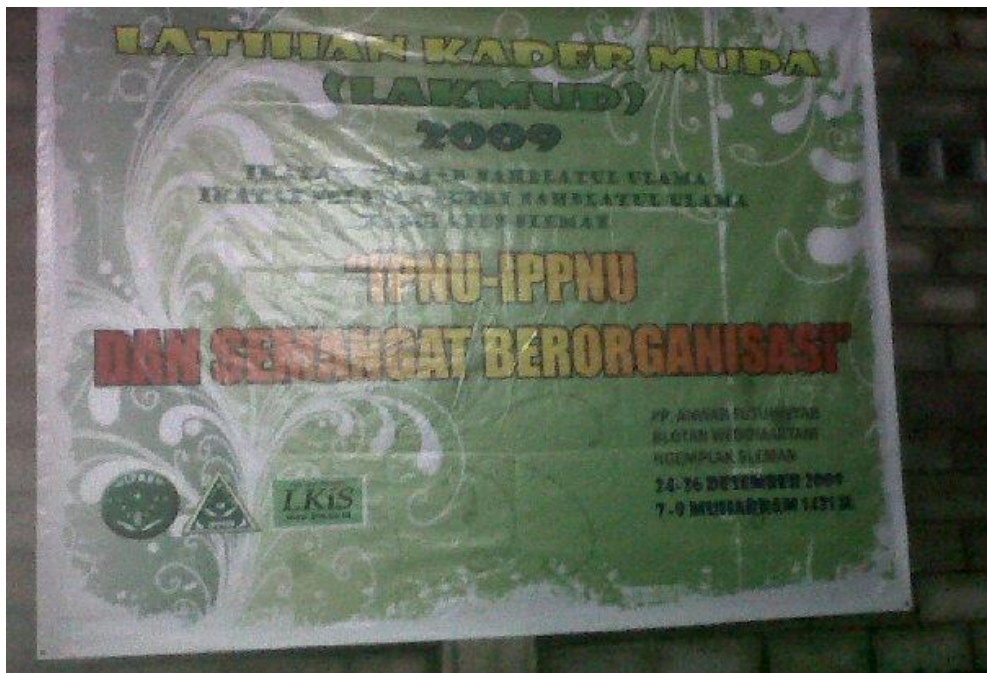
Lakmud PC IPNU Sleman