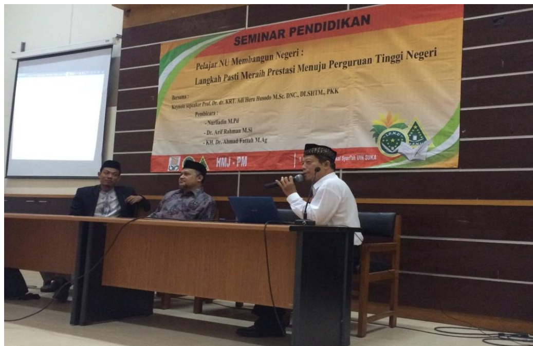
Pendampingan Pelajar Masuk PTN