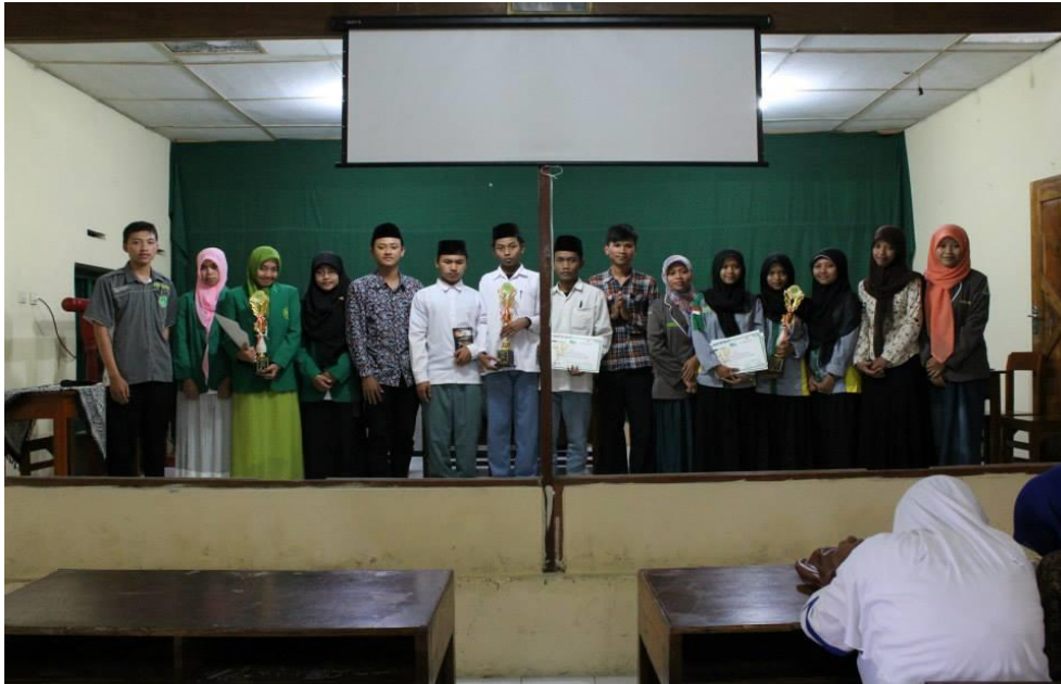
Pendampingan Pimpinan Komisariat