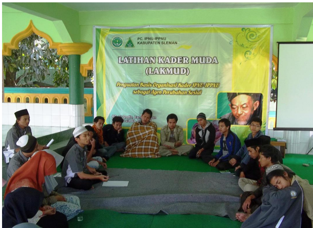
Lakmud PC IPNU SLeMan