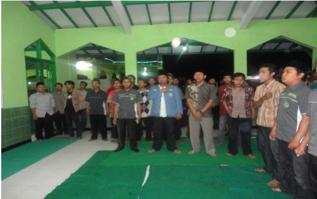
Lakmud PC IPNU Sleman