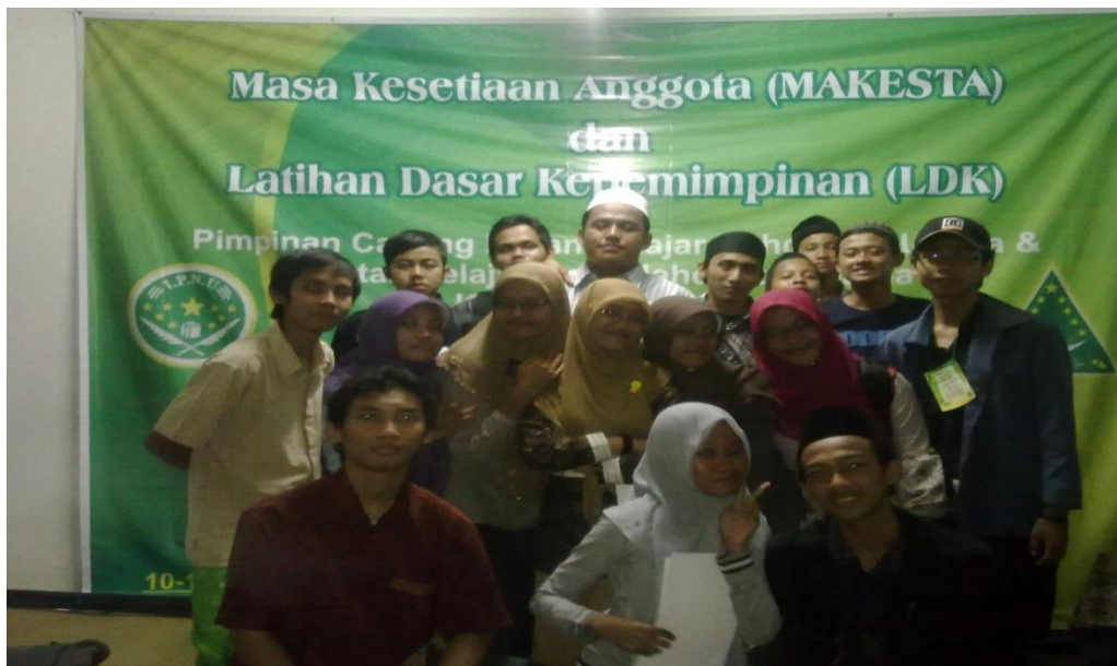
Makesta PC IPNU Sleman