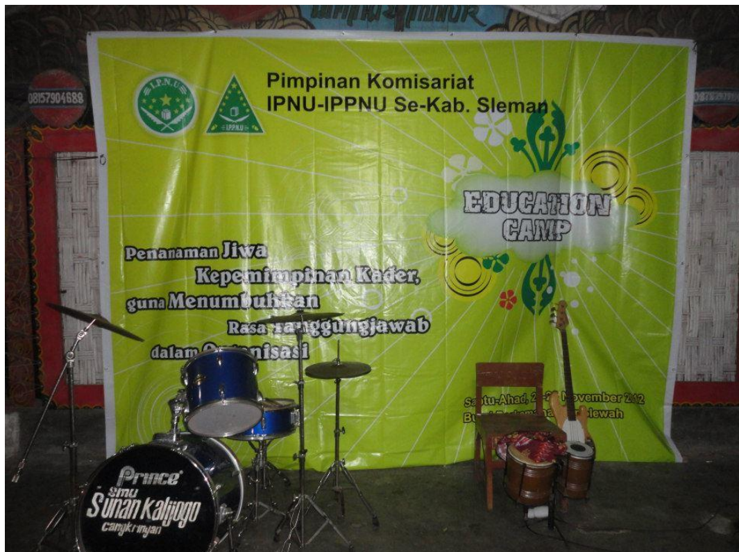
Kemah Bersama Pelajar Se-Sleman