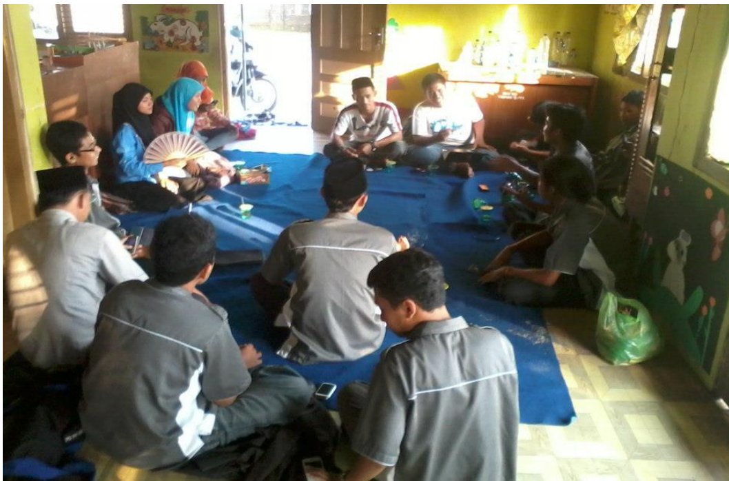
Pendampingan PAC Tempel oleh PC IPNU Sleman