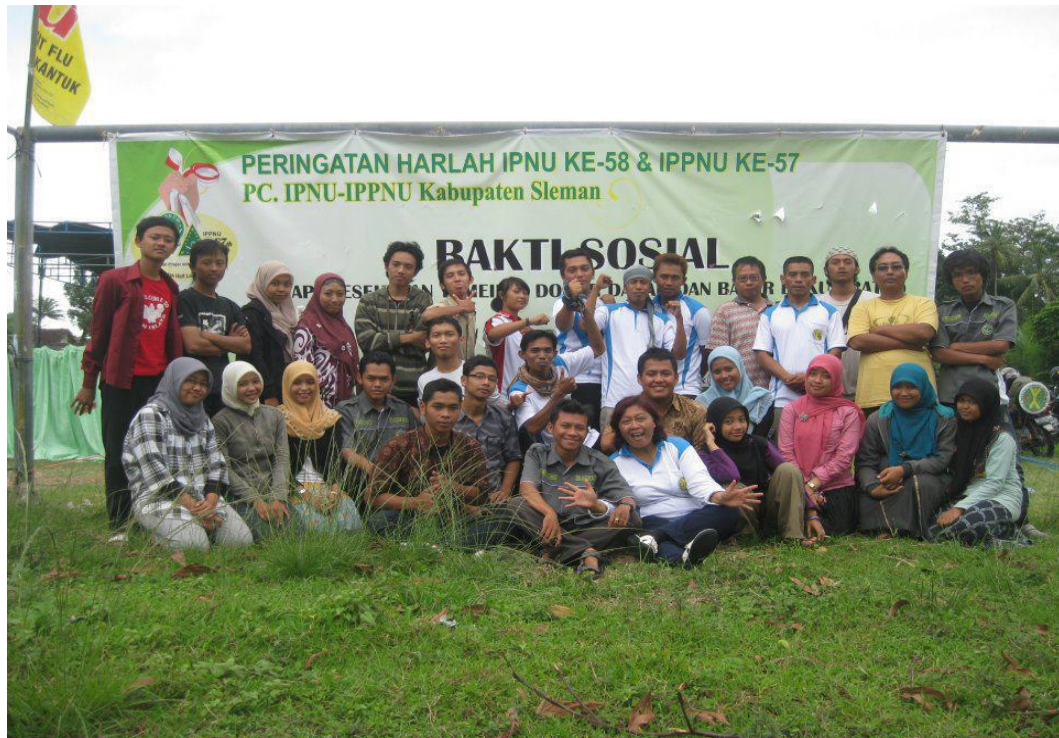
Rangkaian Harlah PC IPNU Sleman