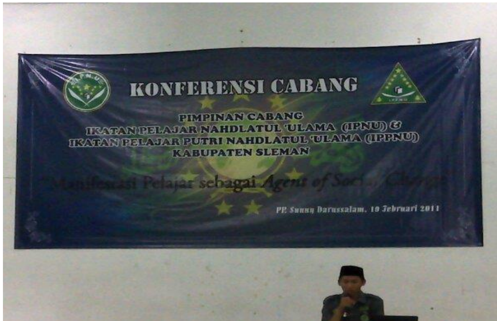
Konfercab PC IPNU Sleman