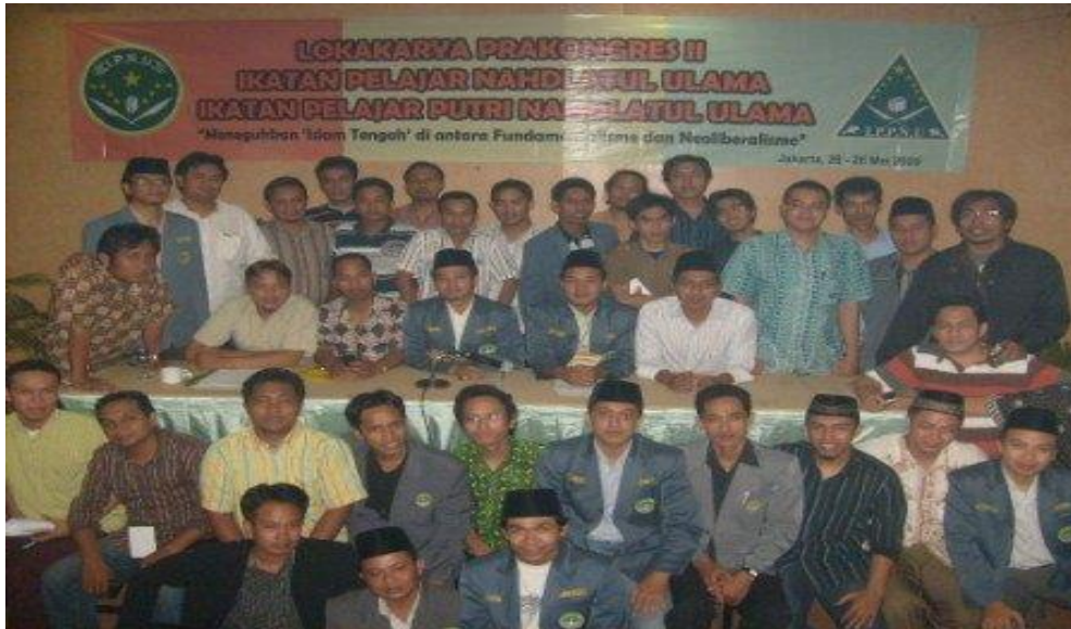
Acara Pra Kongres 2009