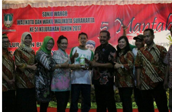
Gambar 12 Penyerahan buah tangan kepada Wali Kota Surakarta

membuat mural di dinding kampung agar lebih indah. Saat ini kompos cair WKKB sedang tahap perizinan untuk dapat menjualnya keranah yang lebih lua