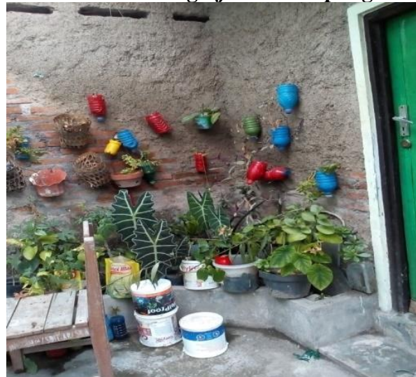
Gambar 14 Hasil Penghijauan Kampung

Ini adalah proses penghijauan lingkungan dengan menggunakan media dinding karena lahan yang sempit.