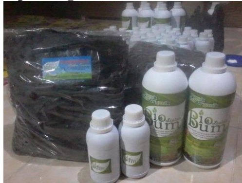
Gambar 10 Pupuk Organik Cair dalam Kemasan

Gambar tersebut menerangkan tentang sampah organik yang telah lama disimpan, sampah tersebut akan menyusut dari kondisi sebelumnya dan menghasilkan air atau yang disebut dengan kompos cair.