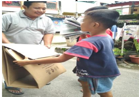
Gambar 4 Proses Penyetoran sampah ke Bank Sampah

Setelah tahap pemilahan di rumah masing-masing, maka setiap satu bulan sekali/dua kali stand bank sampah akan dibuka maka diwajibkan bagi masyarakat untuk menyetorkan sampah mereka ke bank sampah