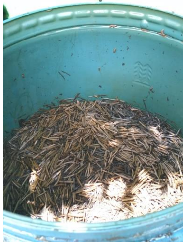
Gambar 9 Penguraian Pupuk Organik

Gambar tersebut menerangkan proses penyemprotan EM4, bahan tersebut adalah cara agar sampah organik mudah terurai, bisa juga menggunakan air bekas untuk mencuci beras sebagai pengganti EM4. 88