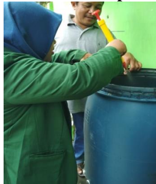
Gambar 8 Proses Pembuatan Pupuk Organik

iris lembut agar mudah di proses atau mudah terurai ketika didalam drum.