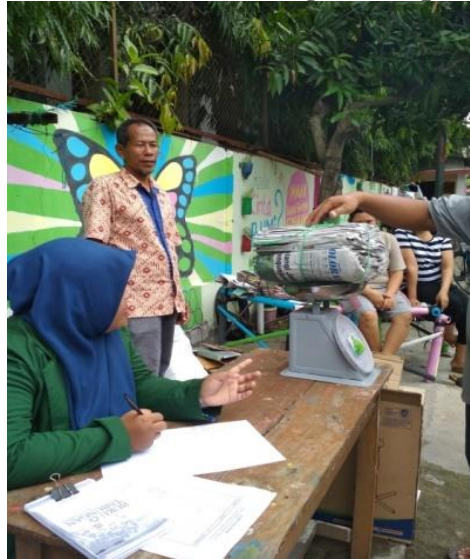
Gambar 5 Proses Penimbangan Sampah