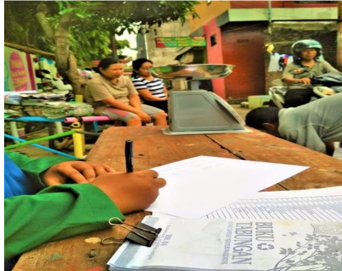
Gambar 6 Proses Pencatatan Tabung