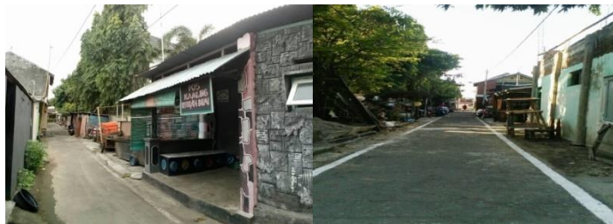
Gambar 1 Keadaan Kampung Sebelum dibersihkan

Selain memanfaatkan sampah organik, menghias kampung menjadi lebih indah juga merupakan tujuan dari program WKKB, masyarakat kerja bakti untuk membongkar barang-barang yang kumuh dan menempel didinding kampung kemudian akan merubahnya menjadi dinding yang indah dengan cara membuat mural sepanjang dinding dikawasan yang sebelumnya kumuh. Berikut adalah gambaran dari lingkungan sebelum dan sesudahnya: 76