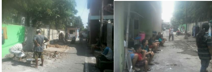
Gambar 2 Proses Pembersihan Kampung