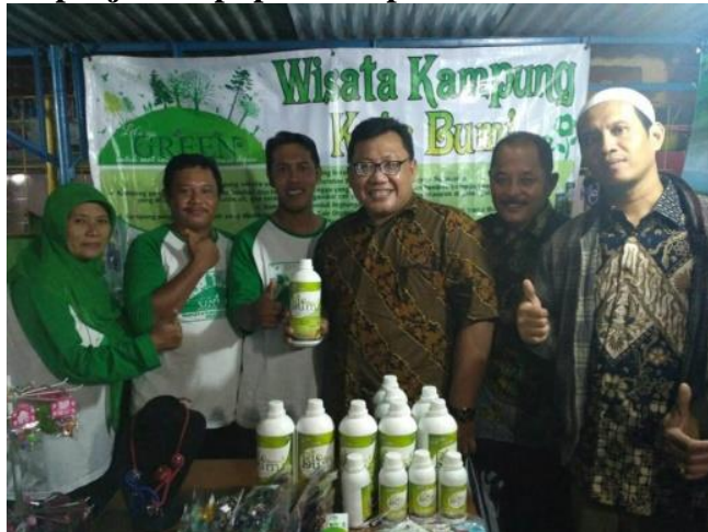
Gambar 11 stand penjualan pupuk kompos cair di bazar laweyan

sebagian besar uang yang sudah terkumpul digunakan untuk mencetak stiker label pupuk kompos cair tersebut. 89