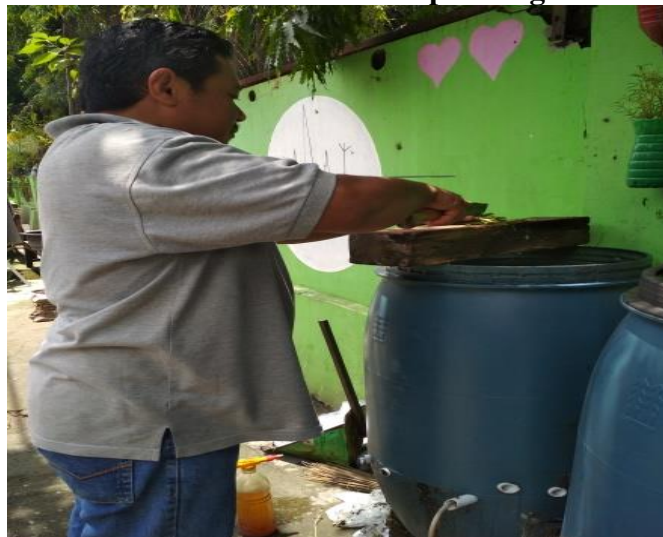
Gambar 7 Proses Pembuatan Pupuk Organik

“selain membangun Bank Sampah kami WKKB juga memanfaatkan sampah Rumah Tangga yang organik dijadikan sebagai pupuk kompos cair, dengan menggunakan bak (drum) yang sudah diberi dari pemerintah, caranya cukup simple dan mudah, warga bisa membuang sampah di bak yang tersedia di depan dan setelah dibuang didalam nanti akan disemprot menggunakan EM4.”