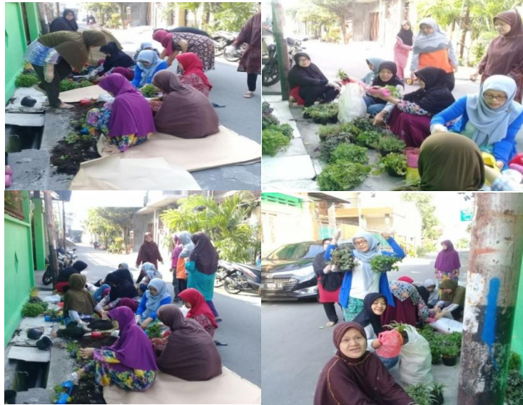
Gambar 13 Proses Penghijauan Lingkungan Kampung