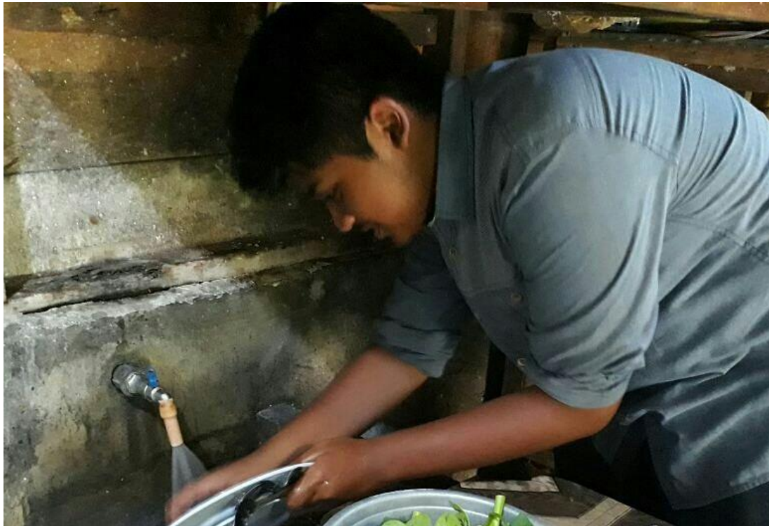
Foto 9 Siswa Membersihkan Perangkat Makan

Menanamkan nilai yang terkandung dalam ayat di atas, tim guru menyusun beberapa konsep yang dapat mendukung spirit yang terkandung dalam ayat tersebut. Siswa SMA Internasional Budi Mulia Dua diwajibkan mengantri saat mengambil jatah makan siang. Hal ini untuk melatih kesabaran dan kehati-hatian agar tidak membuat perbuatan yang kurang terpuji saat perut dalam keadaan lapar dan menyulut emosi orang lain.