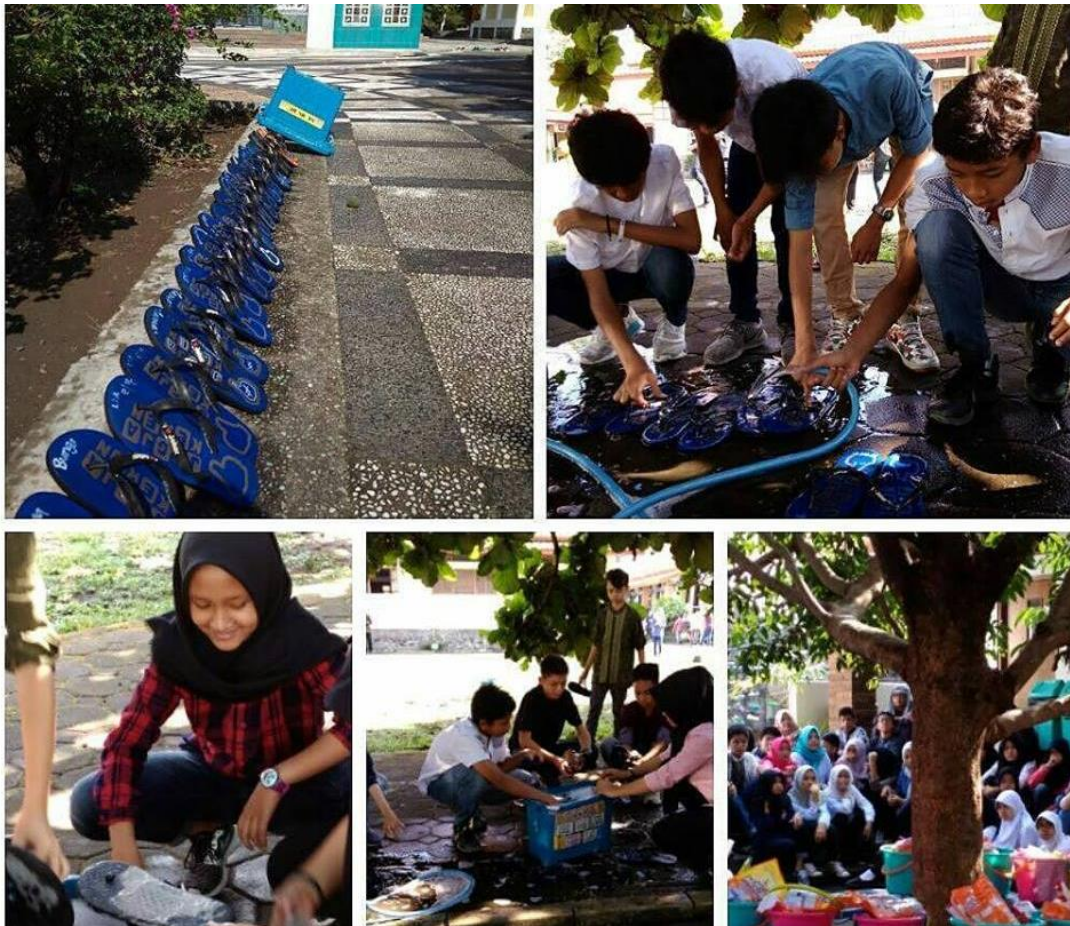
Foto 11 Kegiatan Bersih Lingkungan

Kegiatan khusus yang diadakan untuk menjaga kebersihan lingkungan adalah (1) membersihkan ruang kelas, kamar mandi, dan dapur bersama sama, (2) mencuci sandal yang dipakai untuk berwudhu, (3) membersihkan rak sandal dan sepatu dan (4) membersihkan loker-loker tempat menyimpan barang.