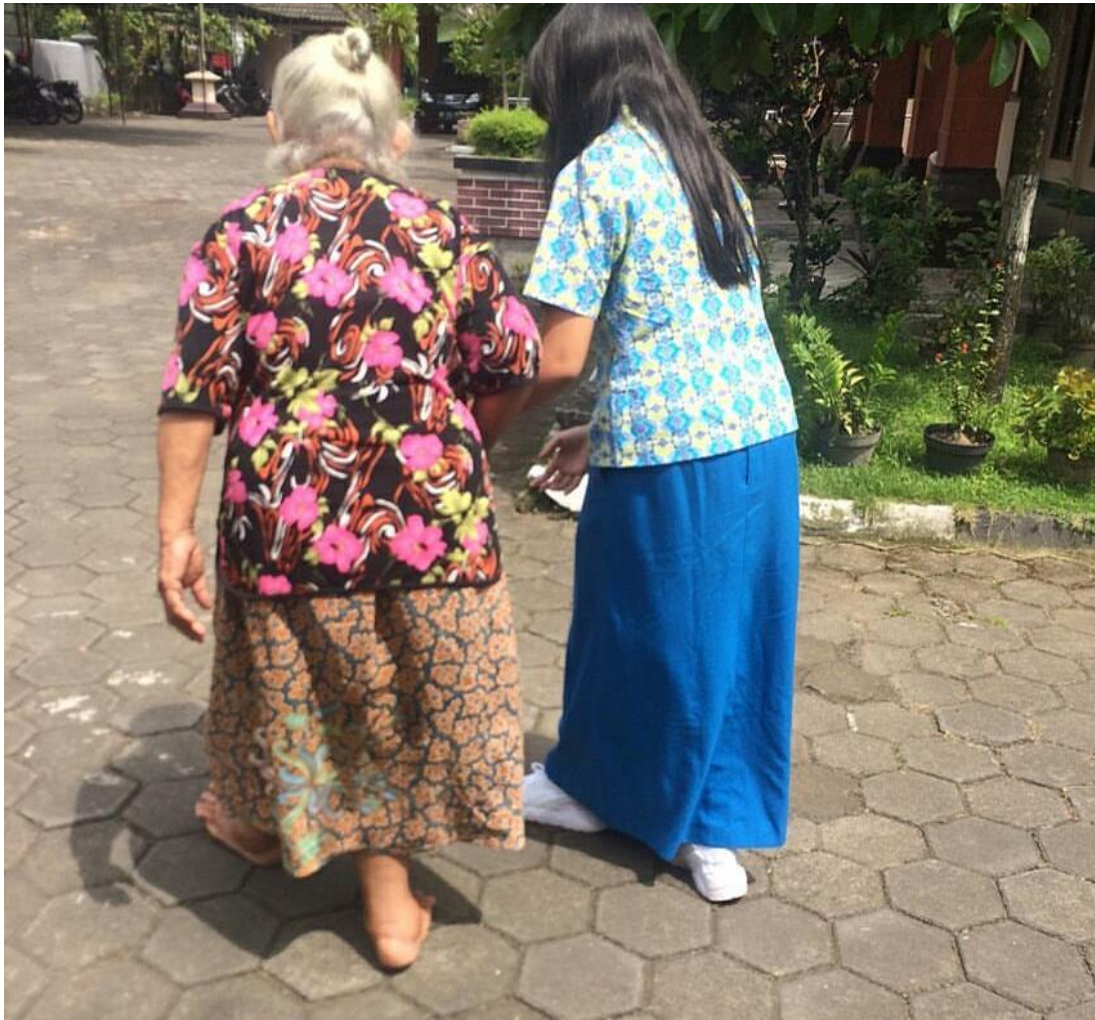
Foto 6Membantu Orang Tua di Panti Jompo

Nilai-nilai yang terkandung dalam kunjungan tersebut adalah kesadaran yang kuat menolong yang lemah. Masa sekarang ini banyak kejadian yang kuat