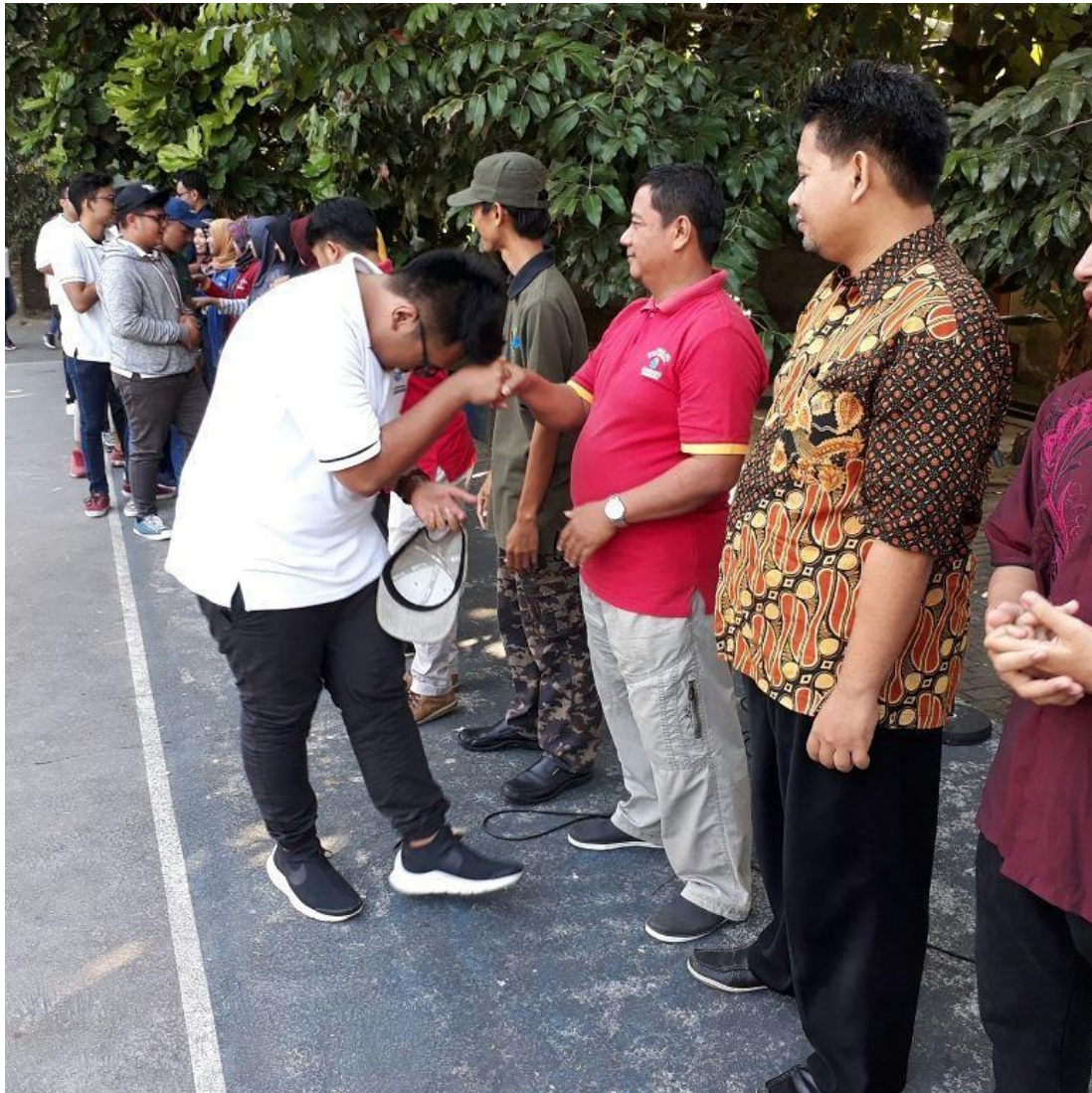
Foto 7 Siswa cium tangan ke guru

Pertemuan yang terjadi antara murid dan guru juga dimanfaatkan oleh guru untuk mengajarkan cara bertutur kata yang sopan. Hal ini mengajarkan siswa untuk memilih kosakata yang sopan, gaya bicara yang baik dalam berbicara kepada siapapun terutama kepada orang tua. Masyarakat yang akan dihadapi oleh siswa kelak adalah masyarakat yang terdiri dari berbagai usia,