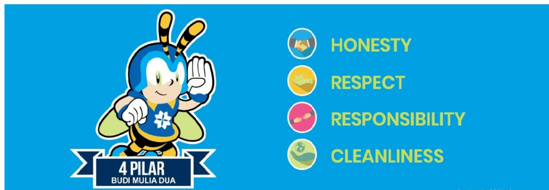
Foto 2Maskot Perguruan Budi Mulia Dua dan Empat pilar

"Bersekolah Dengan Senang dan Senang di Sekolah"