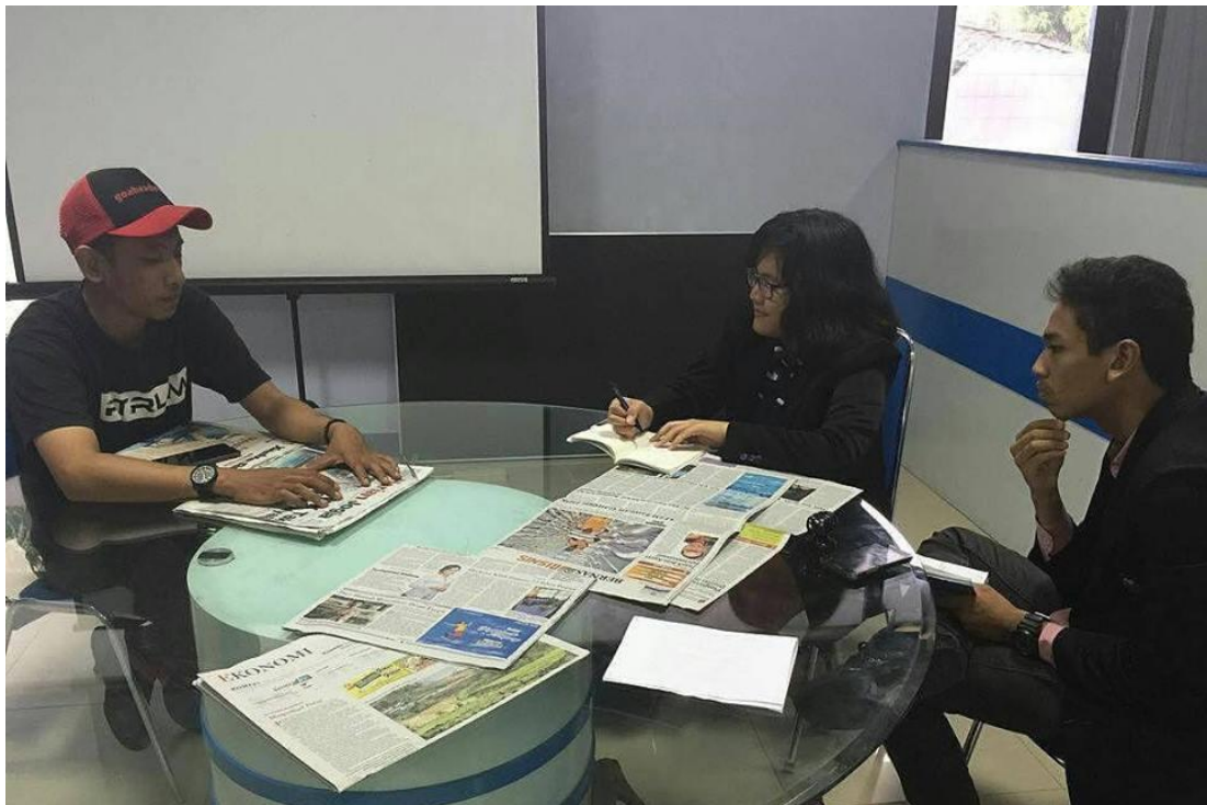
Foto 5Career Week di Radar Jogja

Proses pemilihan konten materi yang sudah selesai disepakati dalam rapat redaksi selanjutnya dilakukan proses pengaturan tata letak sesuai standar baku yang dimiliki oleh Radar Jogja. Setelah semua bahan materi yang akan dicetak siap untuk masuk ke proses produksi, barulah proses produksi dilakukan. Siswa bisa mengetahui bagaimana proses rumit yang terjadi di kantor produksi sebuah koran harian berlangsung tidak sebulan atau sepekan sekali, tetapi kerumitan itu terjadi berulang kali di setiap hari.