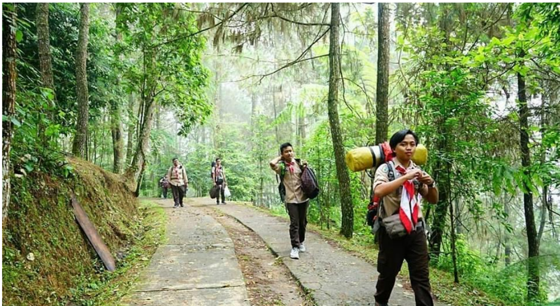
Foto 10 Perjalanan Menuju Lokasi Home Stay

Interaksi yang terjadi antara siswa dan warga sekitar terkadang terjadi perbedaan standar antara kebiasaan di kampung dan di kota tempat siswa tinggal. Misal salah satu contohnya adalah ketika siswa berpapasan dengan warga sekitar saat berjalan, siswa ada yang hanya lewat tanpa bertegur sapa. Sedang warga sangat menunggu mendapat sapaan dari siswa. Kondisi seperti ini disampaikan warga pada waktu lain dengan cara mengobrol sambil santai meminum teh. Siswa yang dalam keadaan santai, menerima komentar warga