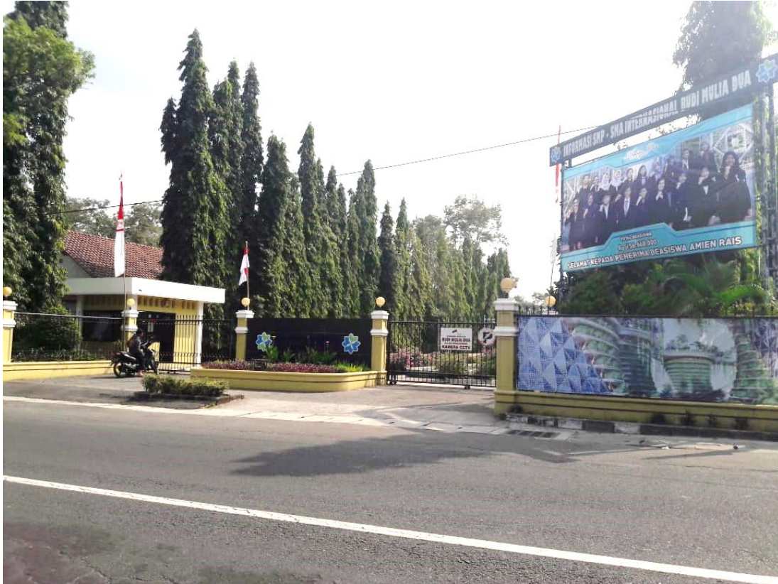
Foto 1 Gerbang Utama Lingkungan SMA Internasional Budi Mulia Dua Yogyakarta

Lingkungan sekolah ini berada di dusun Panjen. Keterangan Lokasi sekolah ini adalah sebagai berikut: