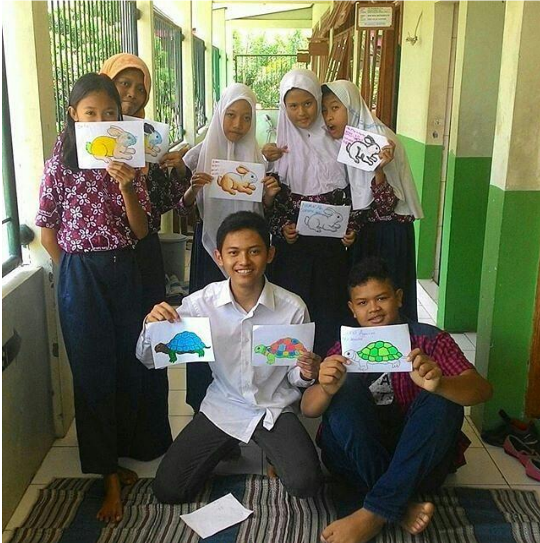
Foto 4 Bersama Siswa SLB Yapenas

sabarnya, terus membimbing mereka. Hal yang positif itu kita dapat bersabar kita dapat bersyukur.” 72