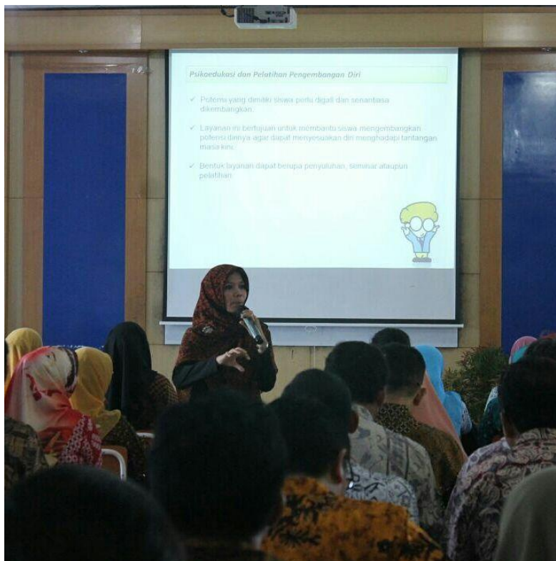
Foto 8 Pertemuan Guru dan Wali Murid

Keluarga adalah faktor penting dalam hidup siswa setelah ia keluar dari lingkungan sekolah. Siswa akan bertemu, berbicara, bertindak dan bersikap sesuai dengan keadaan keluarga. Kekuatan terpenting dalam keluarga terletak pada peran kedua orang tua yang akan mengarahkan kemana tujuan keluarga menjalani hidup.