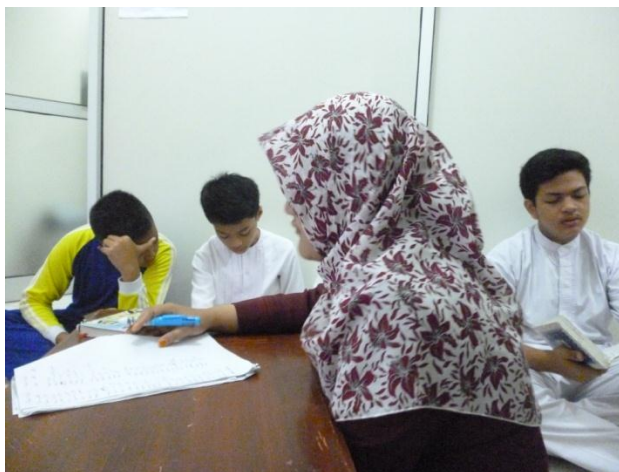
Gambar.2. Proses Setoran Hafalan

”saya ngafalnya udah sejak SD. Disini disuruh ngulang dulu awalnya, suruh nglancarin, terus baru nambah juz 29. Pernah ikut lomba alhamdulillah juara dua.” 34