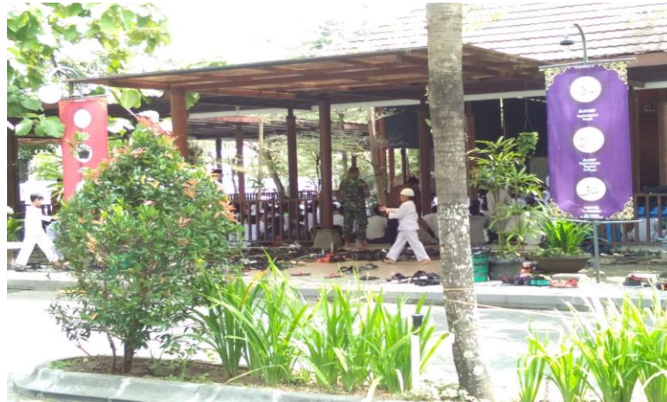
Gambar .4. lafal Asma' al-Husna di depan Student Center

Lingkungan sekolah Al-Azhar terpasang banyak lafal asma' al-husna mulai pintu masuk hingga disetiap sudutnya. Seperti apa yang dituturkan oleh Hafid Asram, Hal itu memang ditujukan sebagai sarana dzikir bagi siapa saja yang melihatnya. Sedangkan untuk kaligrafi hasil dari PAB kaligrafi di taruh pada papan display di lobi SMPIA 26.