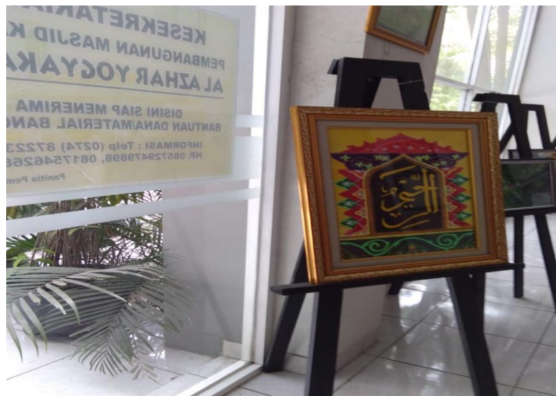
Gambar .5. Kaligrafi asma' al-husna .

Lingkungan sekolah Al-Azhar terpasang banyak lafal asma' al-husna mulai pintu masuk hingga disetiap sudutnya. Seperti apa yang dituturkan oleh Hafid Asram, Hal itu memang ditujukan sebagai sarana dzikir bagi siapa saja yang melihatnya. Sedangkan untuk kaligrafi hasil dari PAB kaligrafi di taruh pada papan display di lobi SMPIA 26.