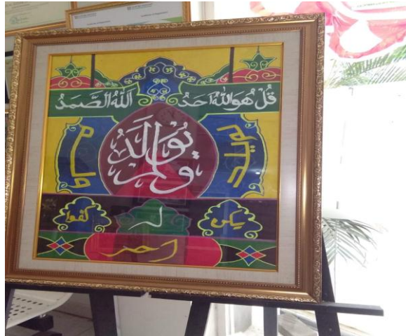
Gambar.3. Kaligrafi surat al-Ikhlâs

potongan ayat-ayat al-Qur'an. Dipilihnya surat-surat pendek disini dikarenakan sudah banyak yang hafal. Untuk potongan-potongan ayat Qur'an dipilih lafal-lafal asma' al-husna .