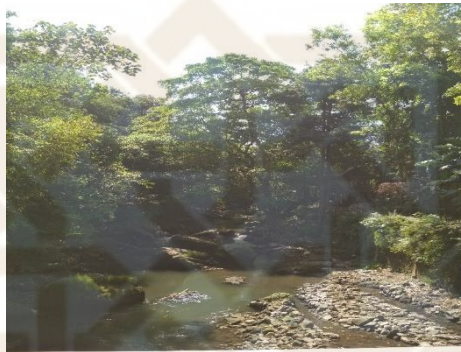
Gambar 2. Sungai Winongo