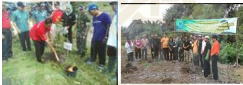
Gambar 6. Penanaman Pohon