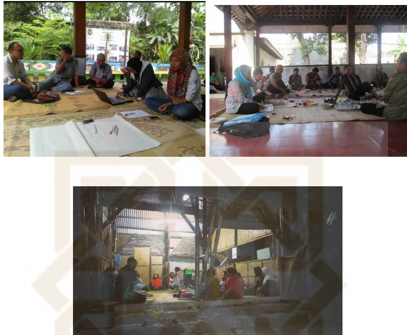
Gambar 9. Pendampingan Masyarakat