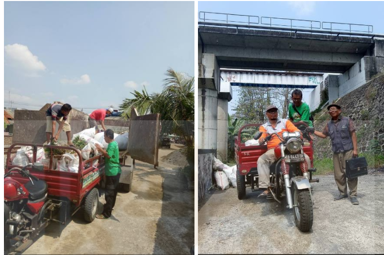
Gambar 8. Pengelolaan Sampah Mandiri