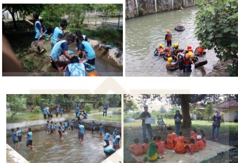
Gambar 7. Sekolah Sungai