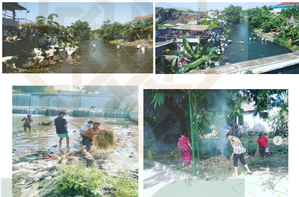
Gambar 4. Merti Kali