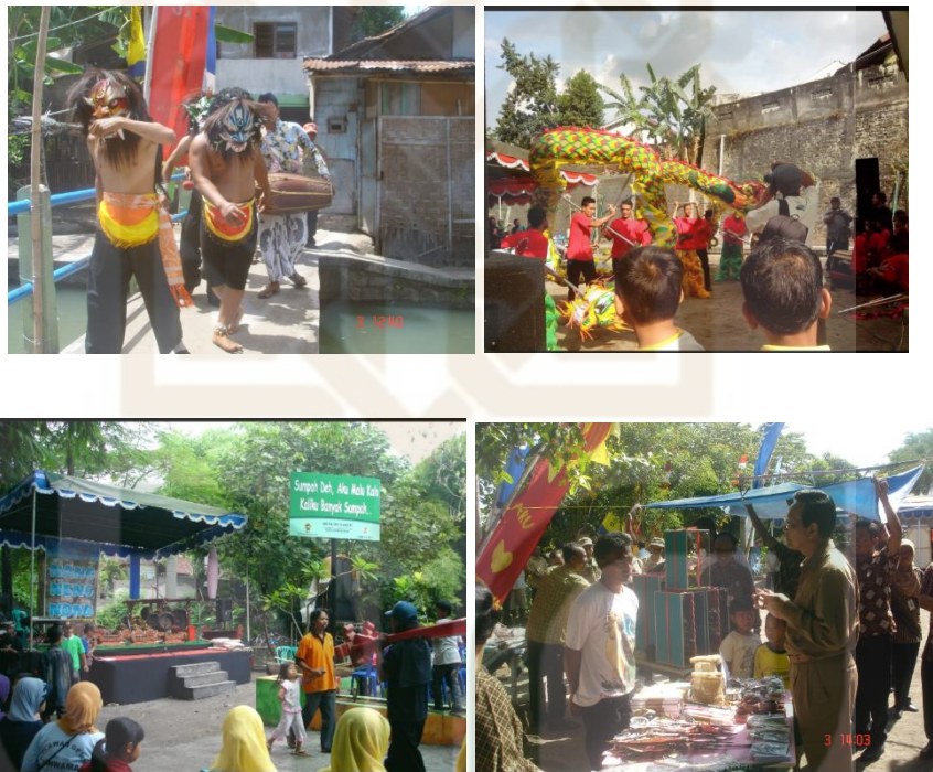
Gambar 5. Festival Winongo

Komunikasi Winongo Asri Yogyakarta. Awalnya kegiatan merti kali ini hanya sebatas bersih-bersih sungai dari sampah, kemudian pada perkembangannya dalam setiap pelaksanaan merti kali mulai dilakukan pemetaan potensi sungai, mulai dari melihat mata air untuk dijaga, menemukan titik sampah dan limbah. Semua temuan-temuan itu kemudian menjadi pembahasan pada pertemuan-pertemuan selanjutnya.