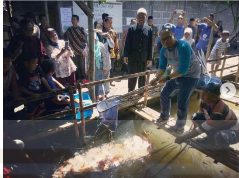
Gambar 10. Suaka ikan dan penebaran benih ikan