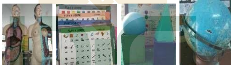
Gambar I.1 Media Pembelajaran IPA, Bahasa Inggris, dan Matematika di MI Kecamatan Imogiri

terdapat di MI Ma'arif Giriloyo 1 untuk mata pelajaran matematika, IPA, IPS, dan bahasa Inggris. 5 Media pembelajaran yang terdapat di MI Ma'arif Giriloyo 2 adalah untuk mata pelajaran bahasa Inggris, IPA, Matematika, IPS, dan 'amma. 6 Sedangkan di MIN Kebonagung, media pembelajaran yang terdapat di Madrasah Ibtidaiyah tersebut adalah untuk mata pelajaran IPA, IPS, dan Matematika. 7 Bapak dan ibu guru juga kesulitan dalam membuat media pembelajaran, faktor yang mendasari permasalahan tersebut adalah waktu. Tuntutan administrasi pembelajaran yang begitu rinci membuat bapak dan ibu guru tidak sempat membuat media pembelajaran. 8 Padahal dalam mata pelajaran Al-Quran Hadis ini guru dituntut untuk mendesain materi yang abstrak menjadi materi yang lebih konkret dan kontekstual dengan dunia siswa. 9