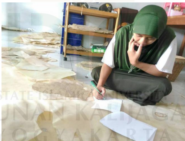
Pengisian Kuisisioner oleh responden