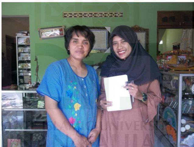
Foto Bersama Pengusaha Kerajinan Kulit