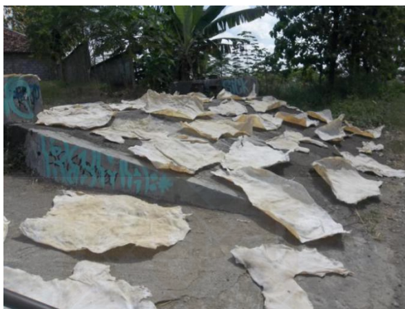
Kulit Sapi yang sedang mengalami proses penjemuran