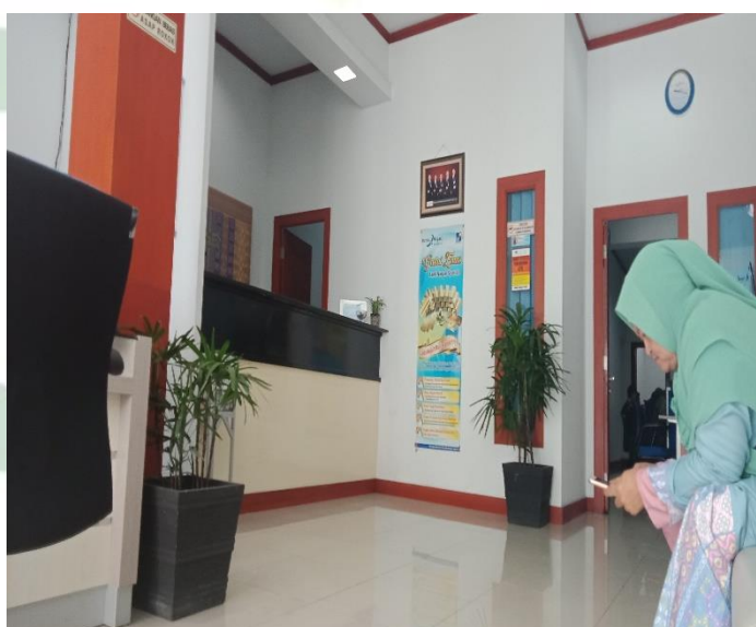
Suasana ruang tunggu Bank Nagari Cabang Syariah Bukittinggi