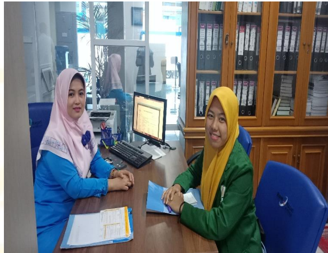
Penyerahan kuesioner penelitian