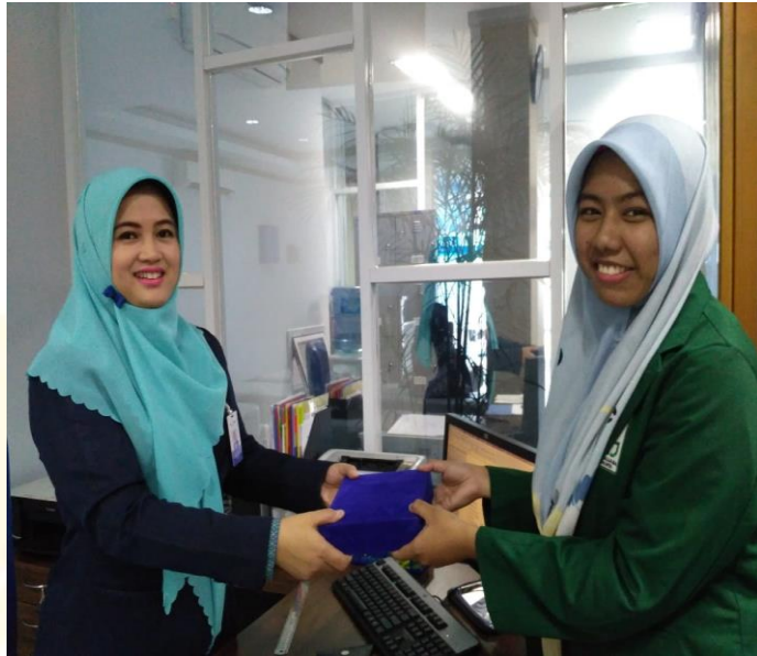
Penyerahan kenang-kenangan sebagai ucapan terimakasih kepada Bank Nagari Syariah