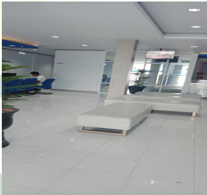
Suasana ruang tunggu Bank Nagari Cabang Syariah Padang