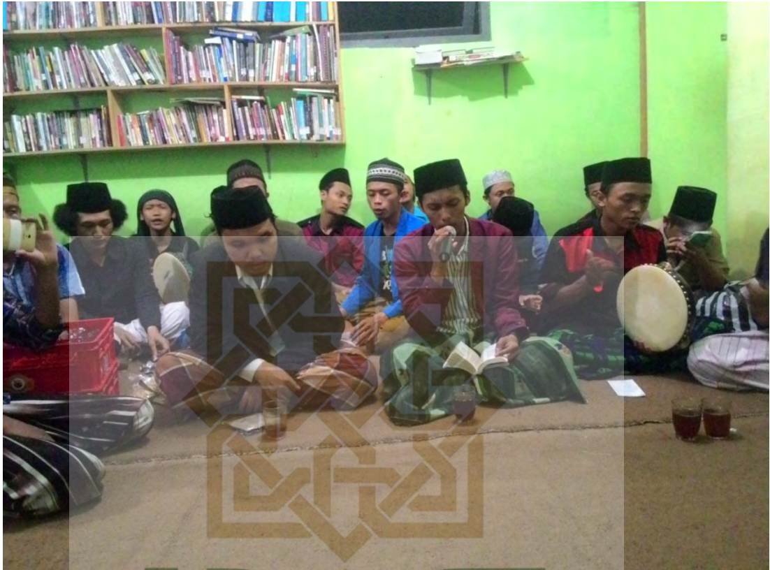
Kegiatan Muhadhoroh (pengajian mini) Santri