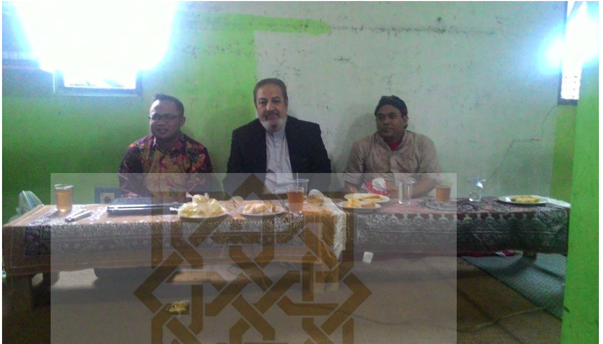
Kunjungan Qori Internasional Iran