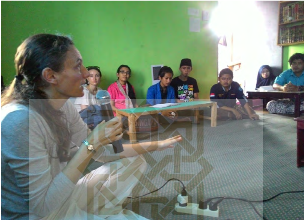
Diskusi dengan Peneliti tamu dari luar negeri