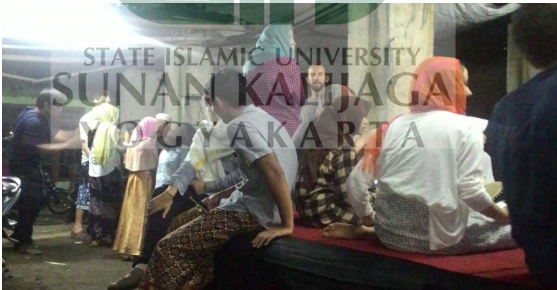
Lebaran bersama para mahasiswa luar negeri