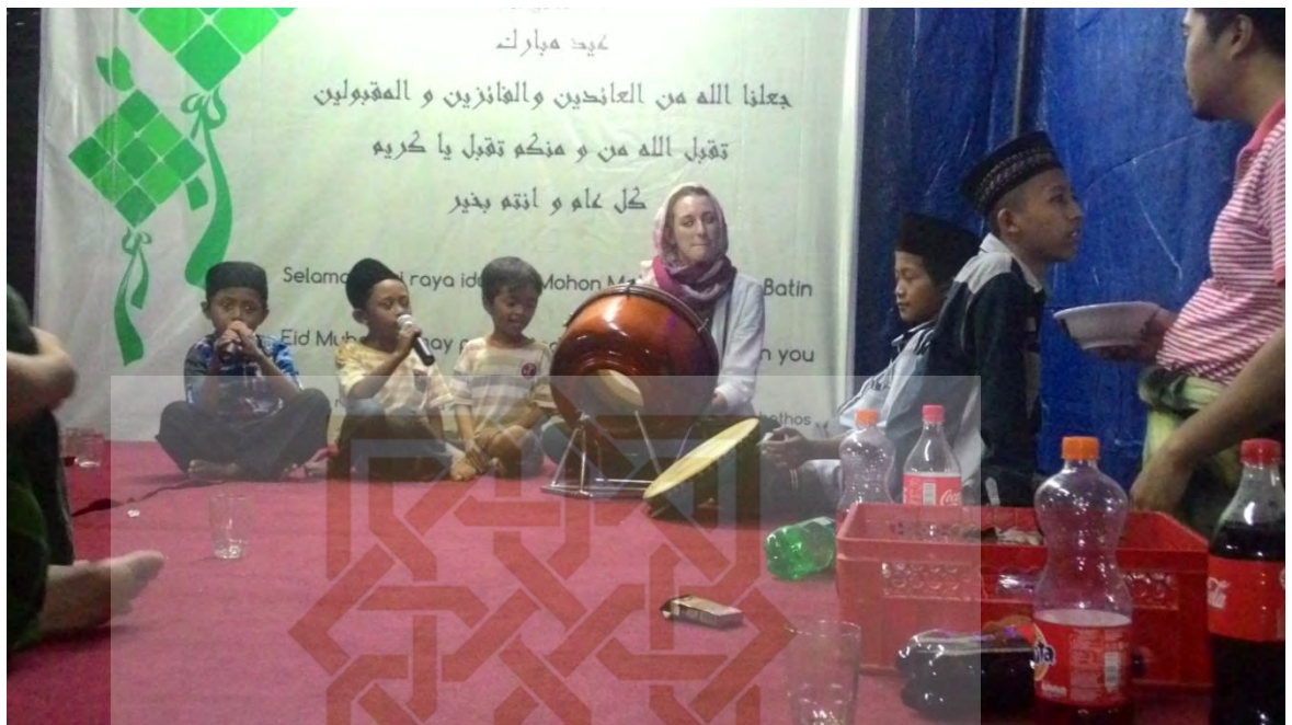
Mahasiswa luar negeri ikut merayakan malam takbiran