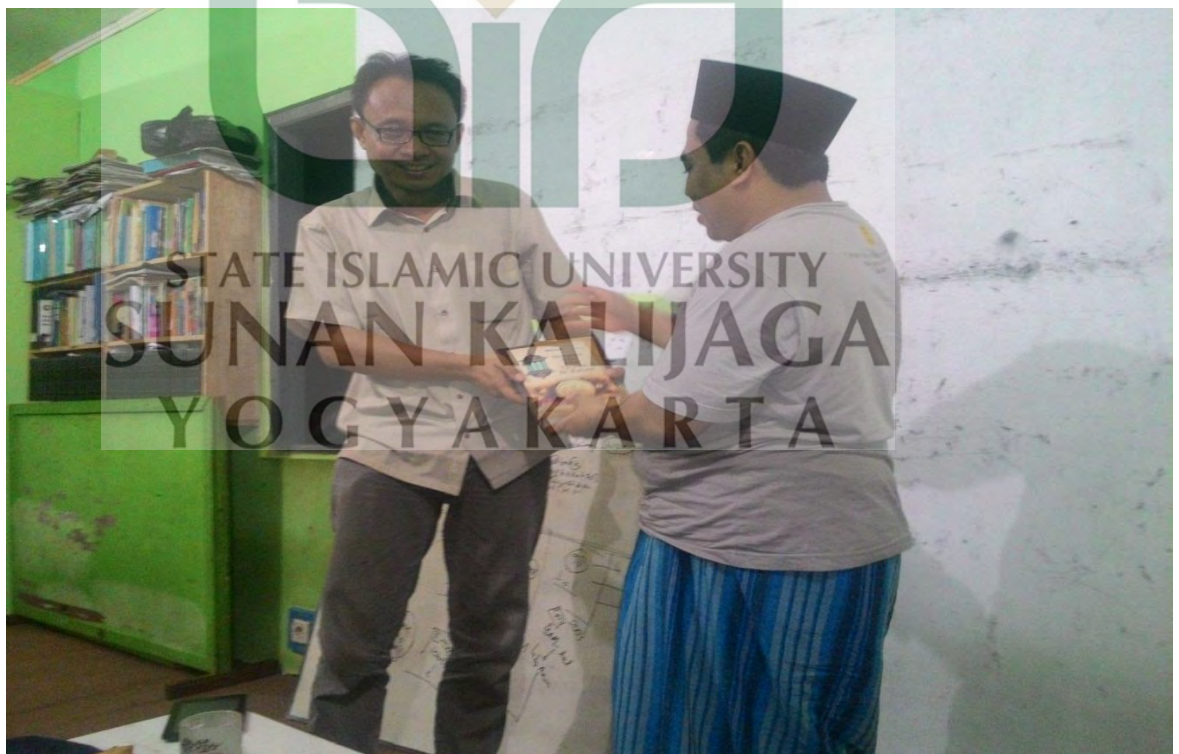
Diskusi dengan Peneliti Pusat Studi Ekonomi Kerakyatan UGM