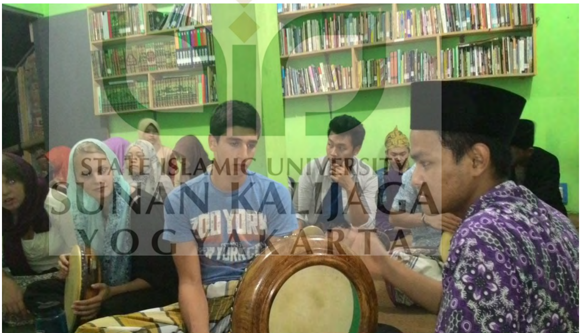
Live-In mahasiswa Luar Negeri