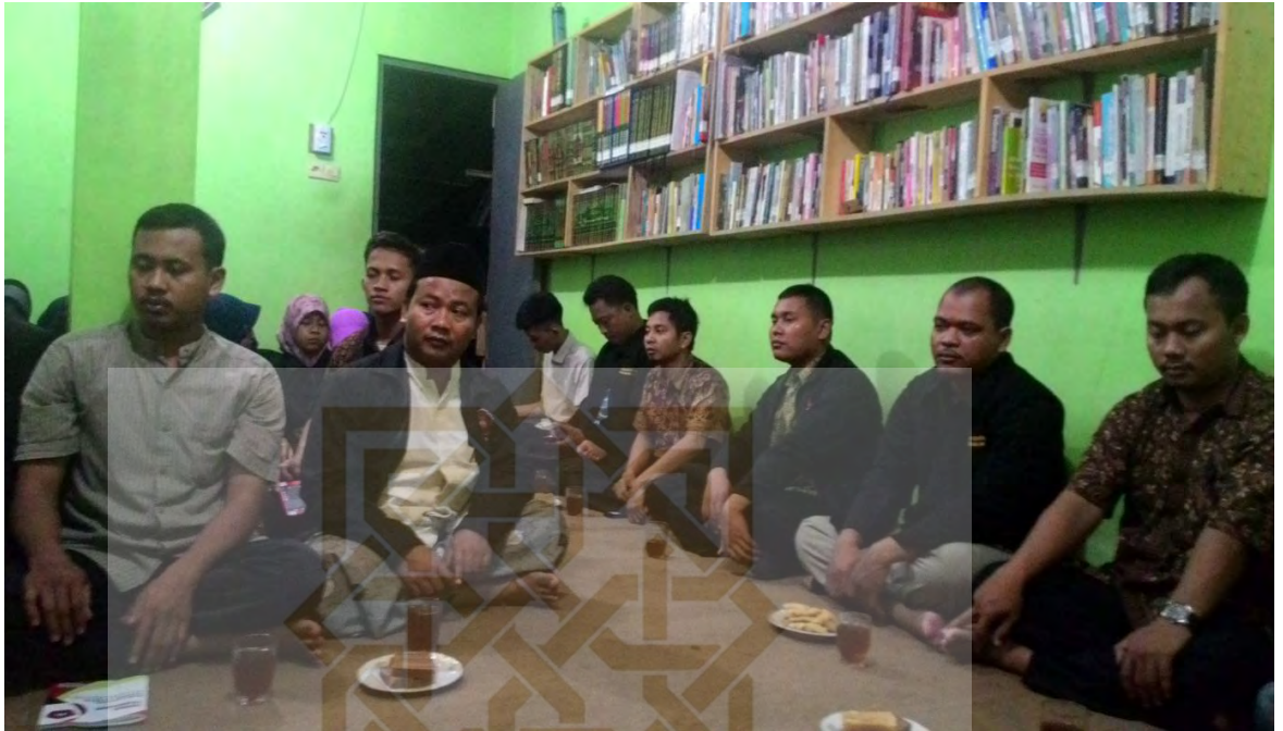
Kunjungan Studi Banding dari Universitas Raden Fatah Demak