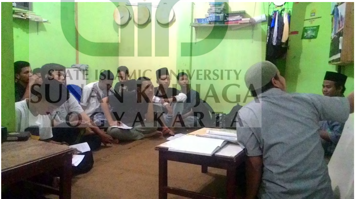
Pesantren Kilat 2016