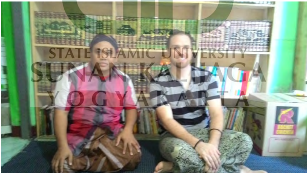
Kunjungan Peneliti Luar Negeri