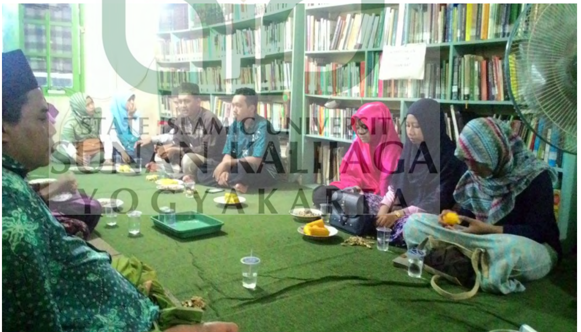
Diskusi dengan para aktifis mahasiswa UGM