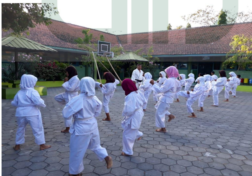
Kegiatan Ekstrakurikuler Kempo MIN 1 Kulon Progo