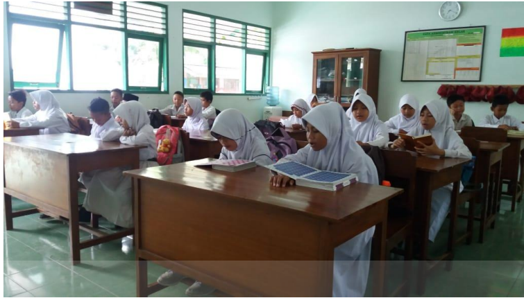
Kegiatan Tadarus Sebelum Pembelajaran MIN 1 Kulon Progo