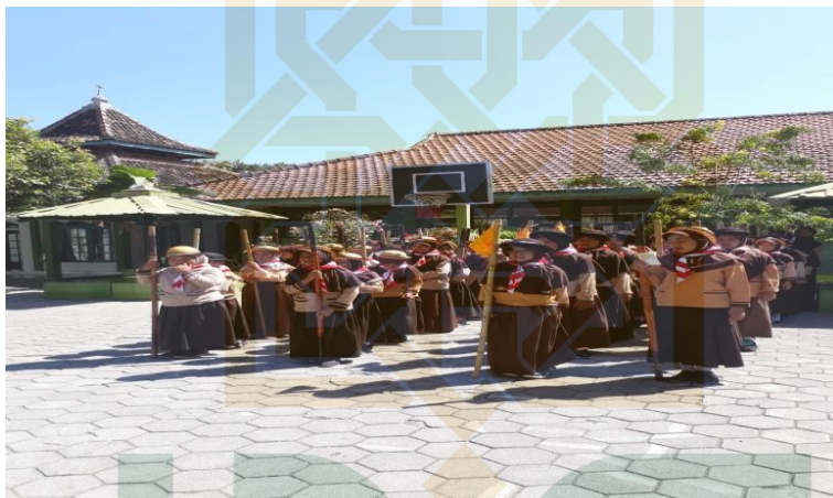
Kegiatan Ekstrakurikuler Kepramukaan MIN 1 Kulon Progo