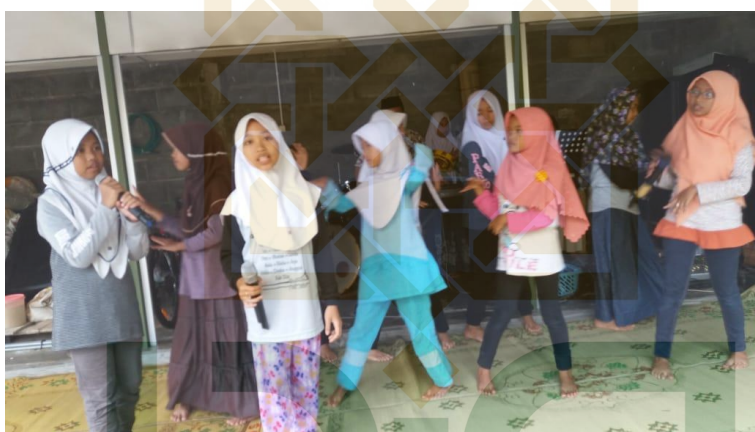
Kegiatan Ekstrakurikuler Qosidah MIN 1 Kulon Progo