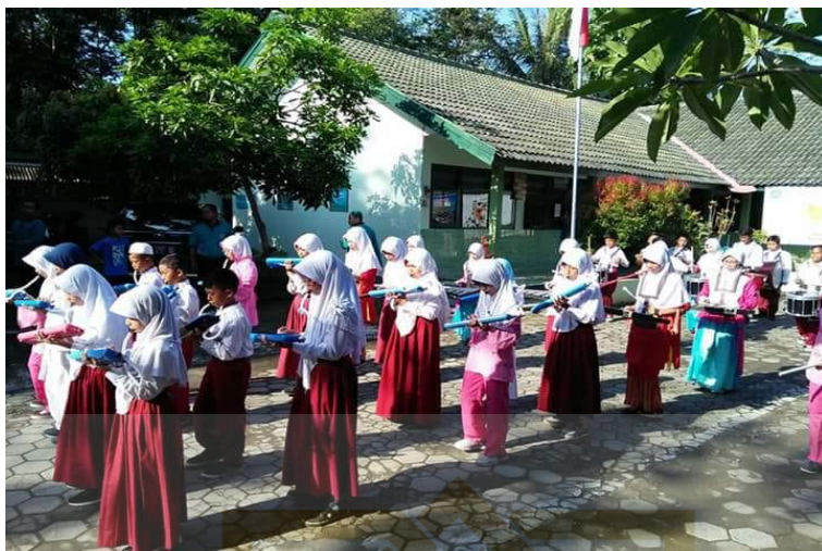
Kegiatan Ekstrakurikuler Drumband MIN 1 Kulon Progo