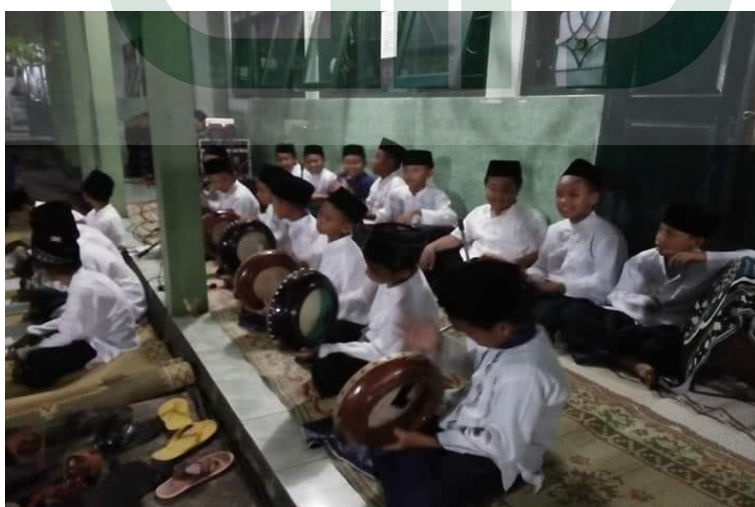
Kegiatan Ekstrakurikuler Hadroh MIN 1 Kulon Progo