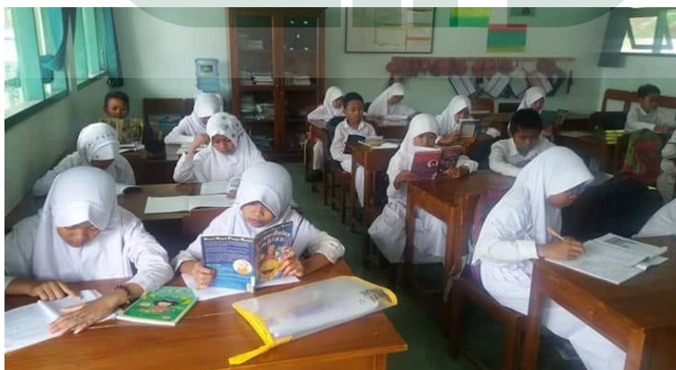
Kegiatan Peningkatan Prestasi (Les) MIN 1 Kulon Progo