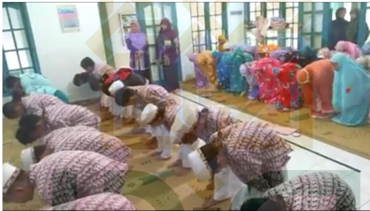
Kegiatan Sholat Dhuha Kelas 1 MIN 1 Kulon Progo