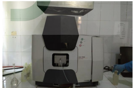
Gambar 6. Alat AAS