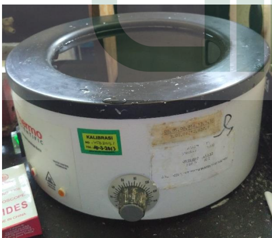
Gambar 11. Water bath