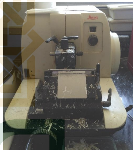
Gambar 10. Mikrotom