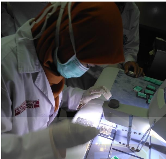
Gambar 7. Proses embedding