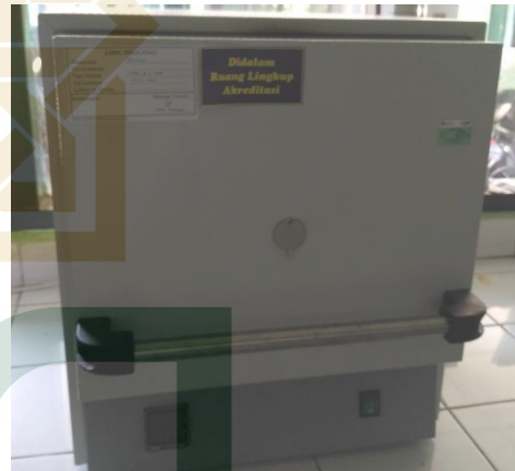
Gambar 4. Alat furnace