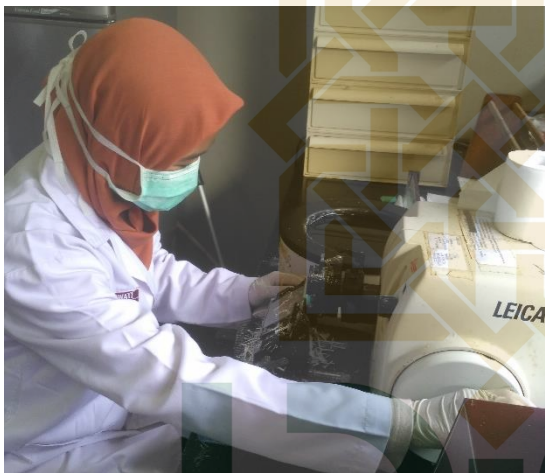
Gambar 9. Proses cutting