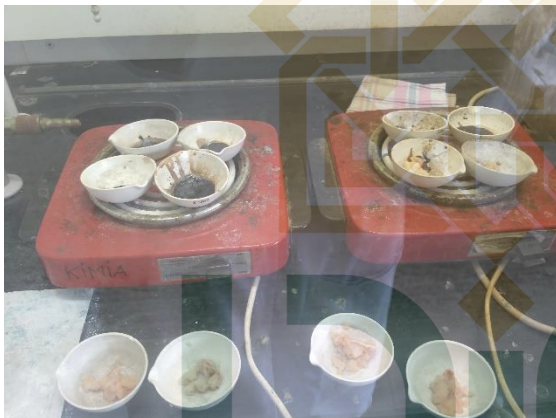
Gambar 3. Proses pembakaran sampel