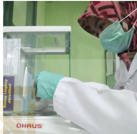
Gambar 2. Proses penimbangan sampel