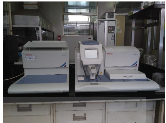
Gambar 8. Alat untuk proses embedding