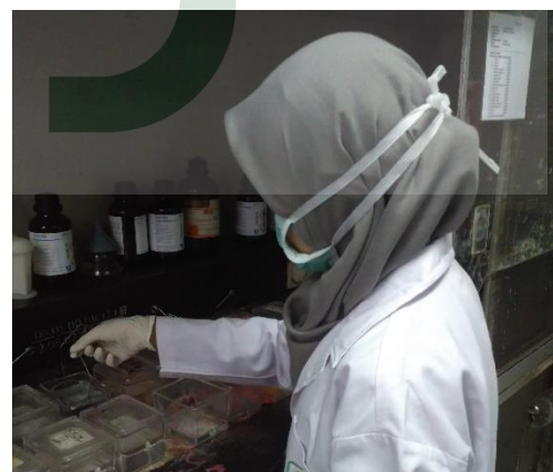
Gambar 12. Proses staining