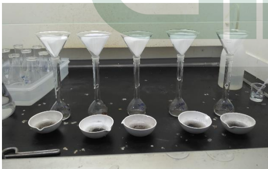
Gambar 5. Proses penambahan HNO 3