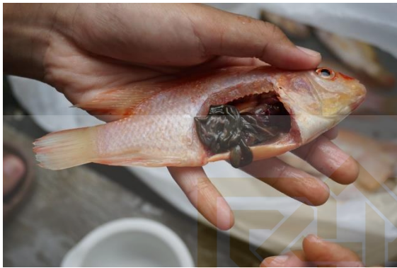
Gambar 1. Proses pembedahan ikan