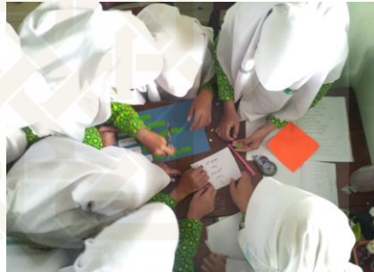
FOTO MODEL PEMBELAJARAN KOOPERATIF TIPE CARD SORT