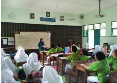
FOTO MODEL PEMBELAJARAN KOOPERATIF TIPE SCRAMBLE