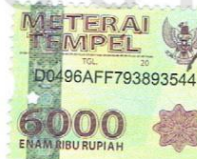
Iva Nur Azizah 15840031