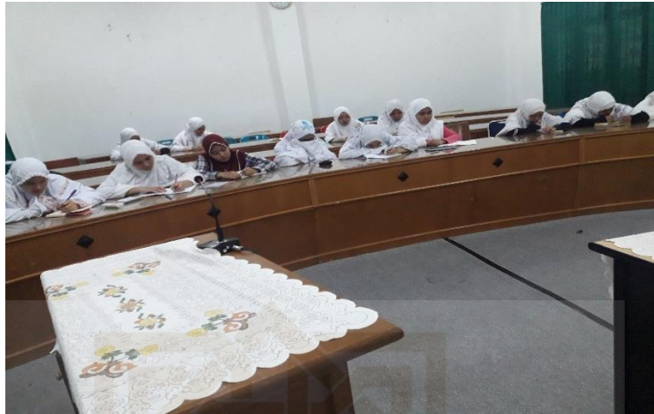
Suasana belajar di kelas kontrol