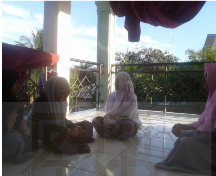
Suasana wawancara beberapa santri kelompok eksperimen