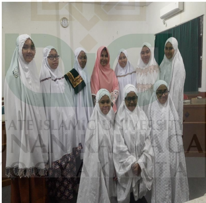
Santri kelompok kontrol