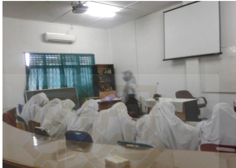
Suasana Pre-Test kelas Kontrol