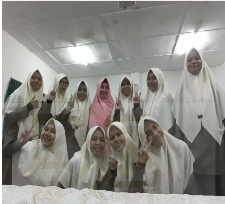
Santri kelompok eksperimen