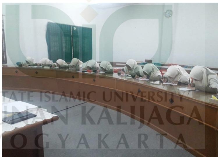
Suasana Post-test kelas eksperimen