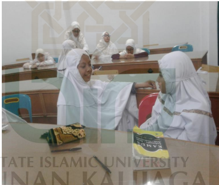
Suasana santri kelas eksperimen Post-test kalam

STATE ISLAMIC UNIVERSITY SUNAN KALIJAGA YOGYAKARTA