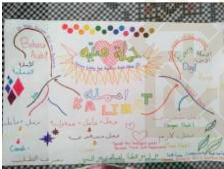
Hasil Pembuatan Mid Map