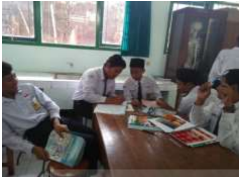
Pembuatan Mind Map