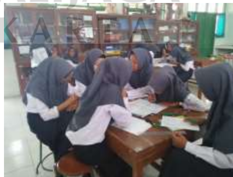
Pembuatan Mind Map