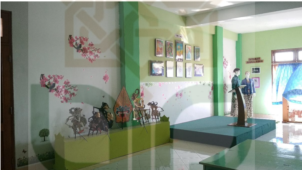
Pameran Literasi Budaya Jawad an Panggung Mini lantai 3