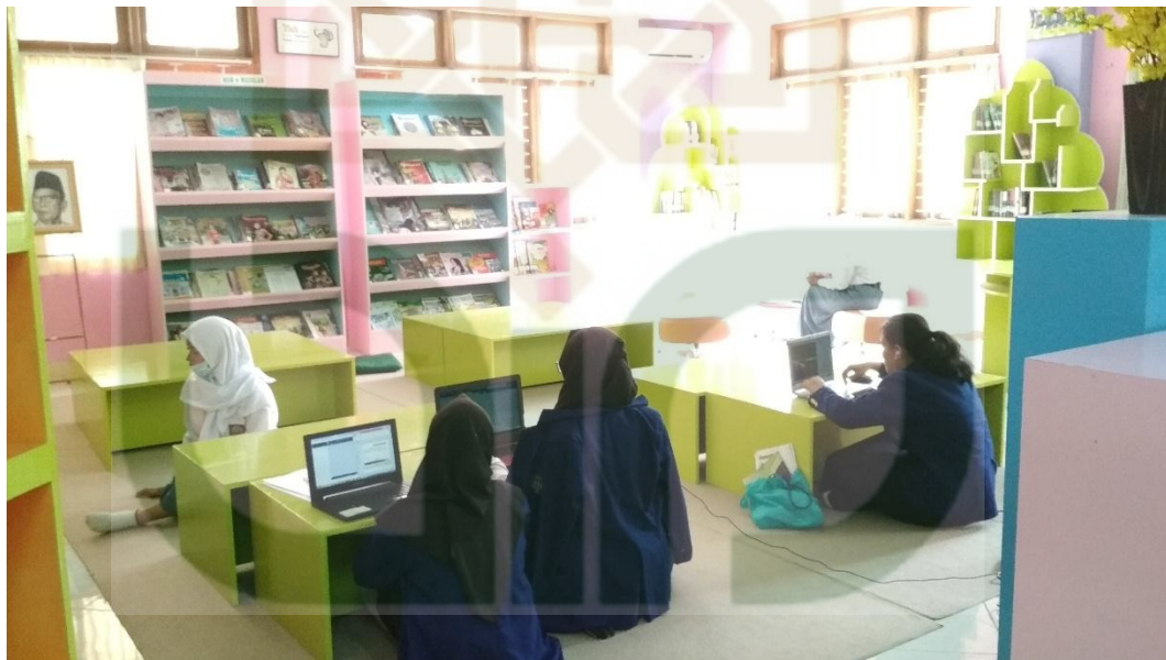
Ruang Baca Lesehan dan layanan koleksi