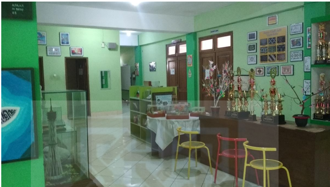
Pameran Karya Literasi Siswa pada lantai 2