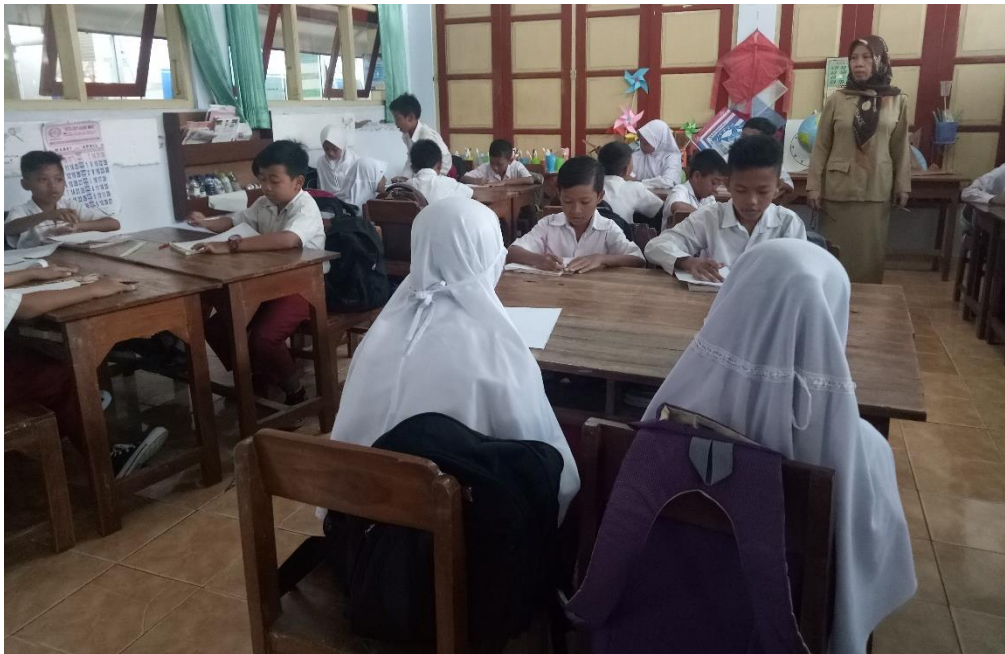
Guru Keliling untuk Memantau Peserta Didik