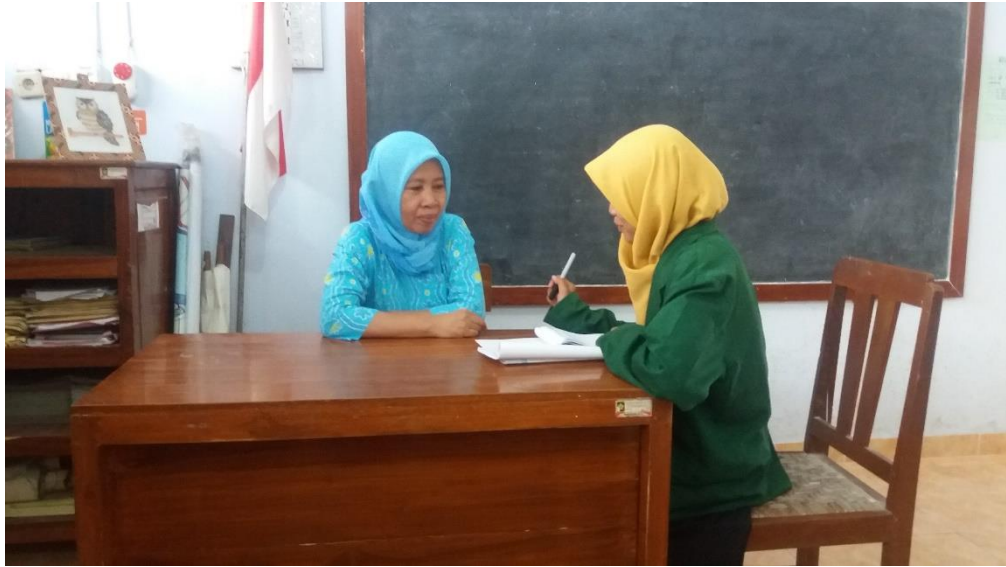
Dokumentasi Wawancara dengan Guru