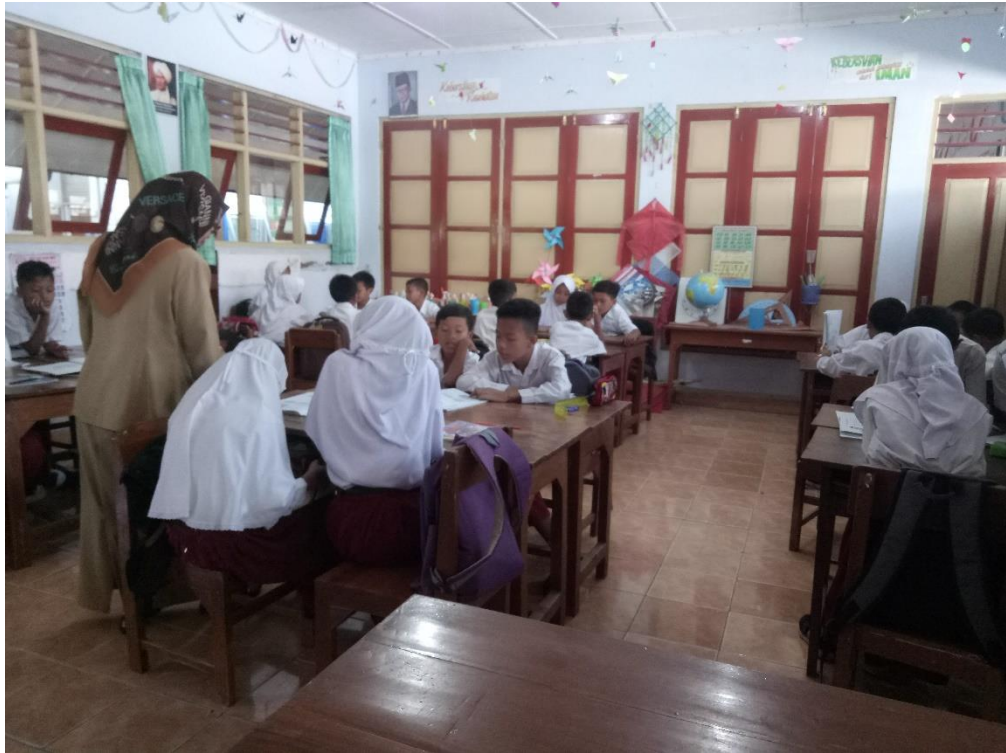
Formasi Kotak Kecil