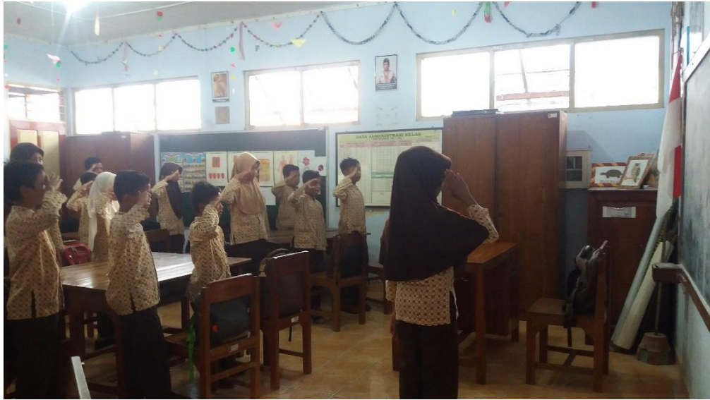
Dokumentasi SOP Pagi (Hormat pada Bendera)