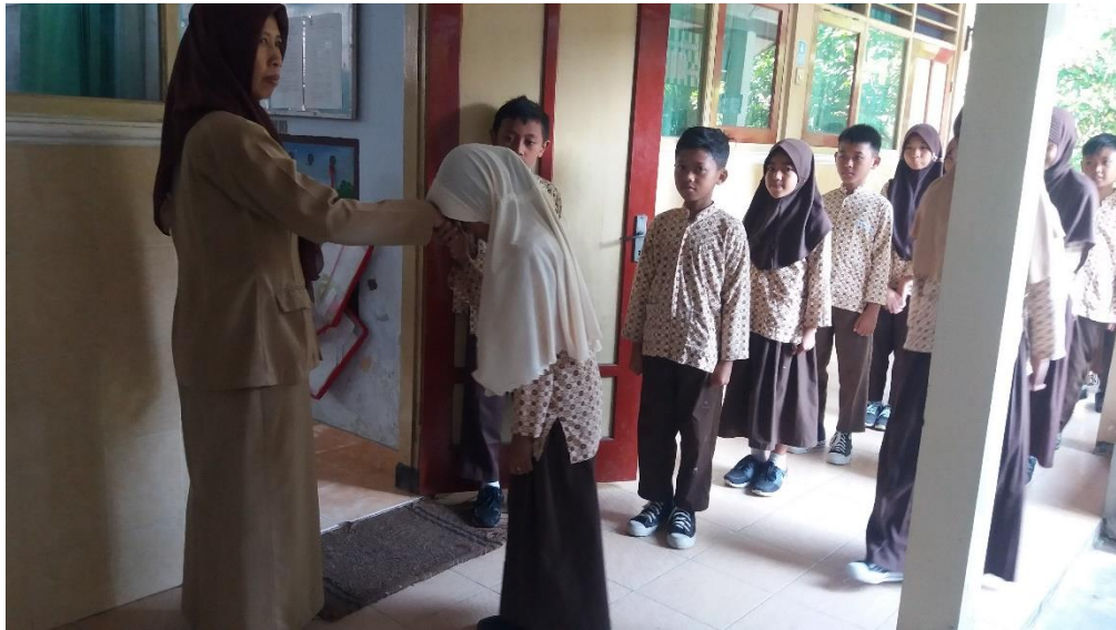
Dokumentasi SOP Pagi (Baris di Depan Kelas dan Bersalaman dengan Guru Kelas)