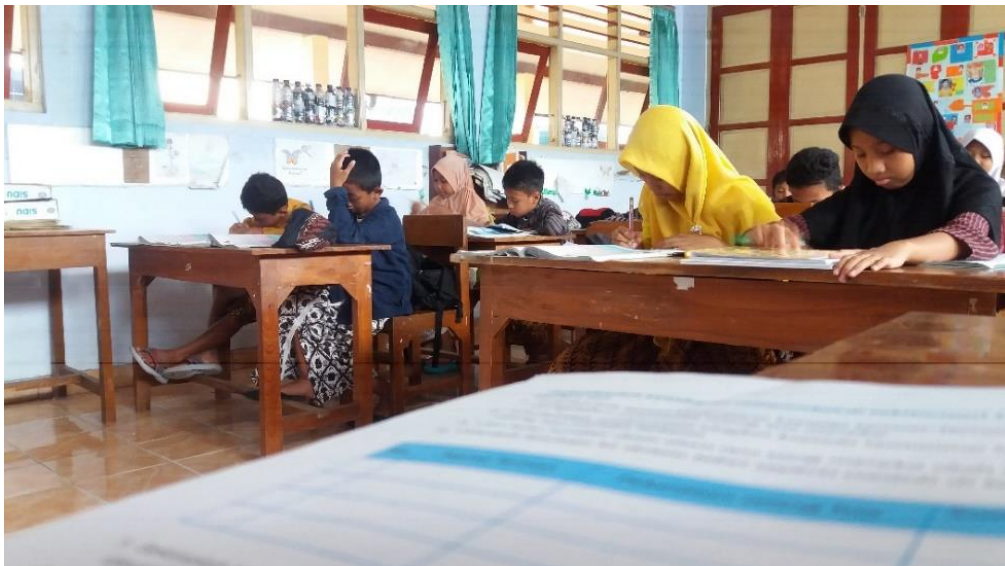
Formasi Kotak Kecil (Tradisional)