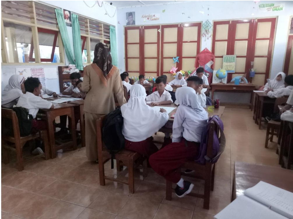
Guru Menjelaskan Materi