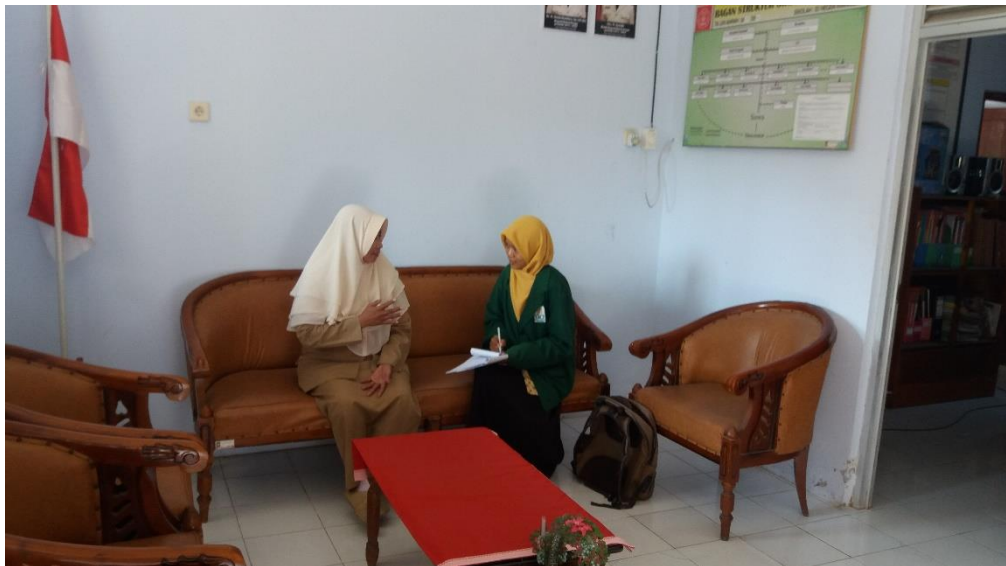
Dokumentasi Wawancara dengan Kepala Sekolah