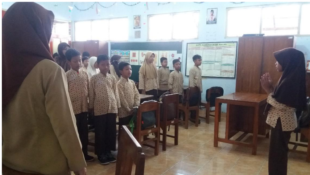
Dokumentasi SOP Pagi (Menyanyikan Lagu Indonesia Raya 3 Stanza)