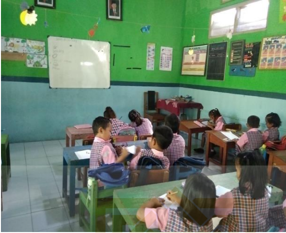
Foto 3 Kegiatan pembelajaran di dalam kelas