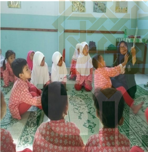
Foto 8 Kegiatan bercerita menggunakan buku cerita bergambar