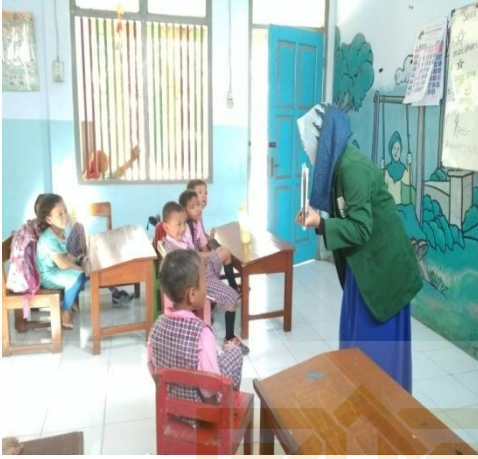
Foto 9 Kegiatan bercerita pada siklus II menggunakan buku cerita bergambar