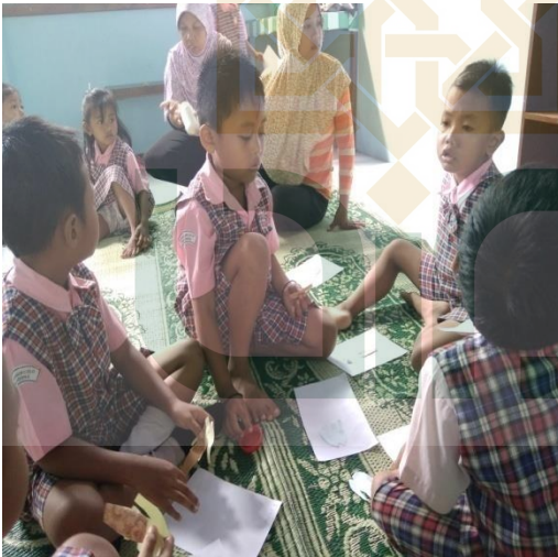
Foto 4 Kegiatan siklus I membuat kebaya