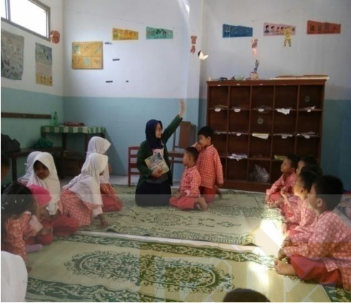
Foto 7 Kegiatan pada siklus II Menggunakan buku cerita bergambar