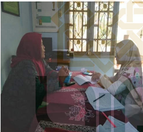
Foto 12 Peneliti mewawancarai pendidik