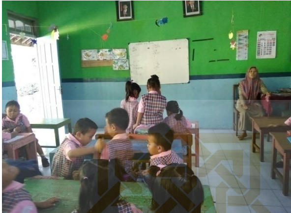
Foto 1 observasi pra tindakan kegiatan saat di dalam kelas