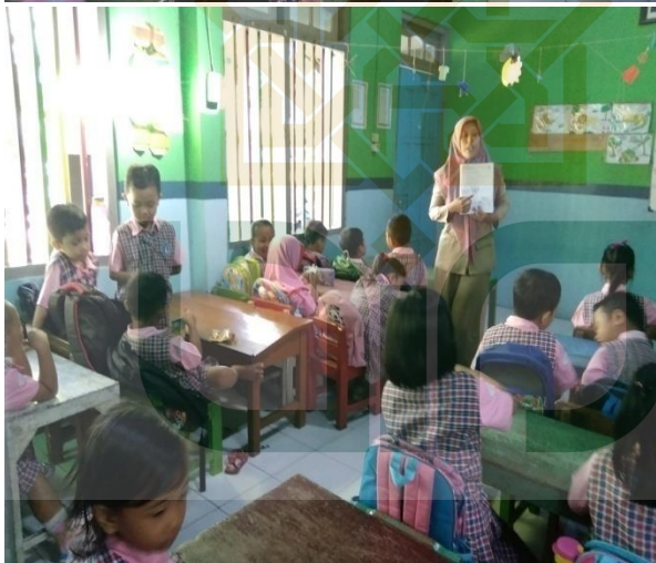
Foto 2 Kegiatan pembelajaran di dalam kelas