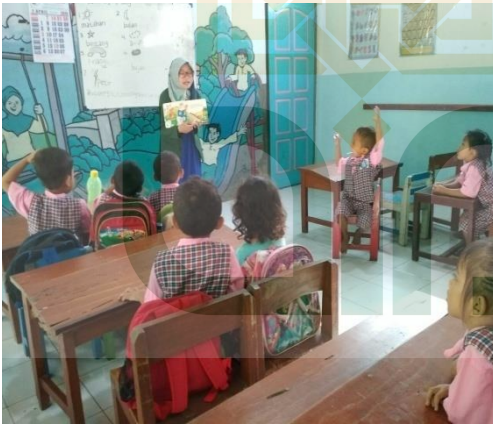
Foto 10 Kegiatan saat di dalam kelas menggunakan buku cerita bergambar