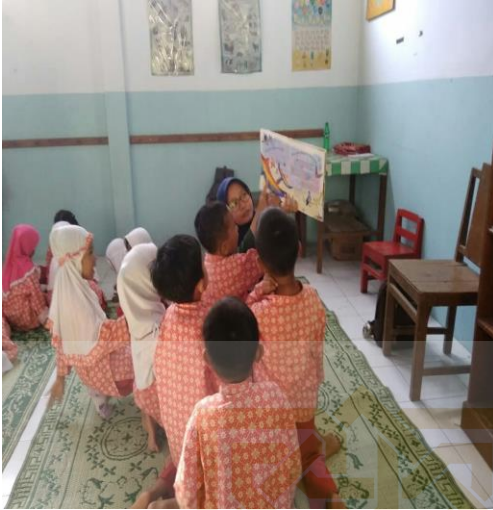
Foto 11 Keingin tahuan anak saat melihat buku cerita bergambar