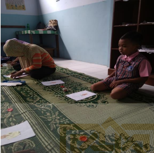
Foto 5 Kegiatan siklus I Orang tua yang membantu menyelesaikan tugas anaknya.