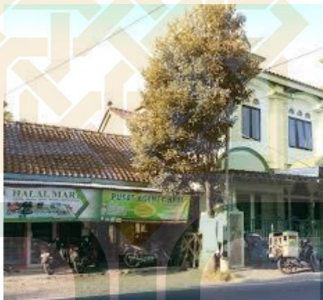
Gambar. Rumah bekam Avicenna tampak depan