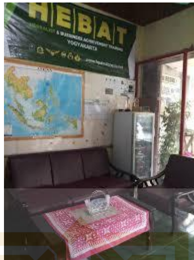
Gambar. Ruang tunggu tamu pasien klinik bekam Avicenna