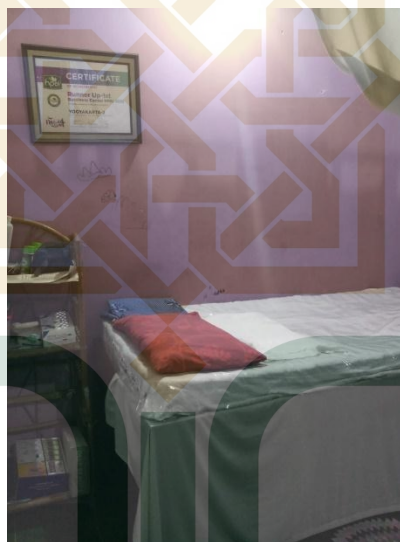
Gambar. Tempat praktik pengobatan bekam Avicenna