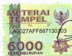
Alwi Ansori 15550036