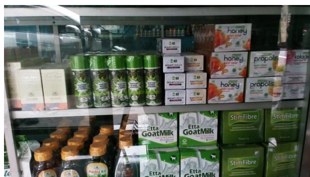
Gambar. Obat-obatan herbal di klinik bekam Avicenna